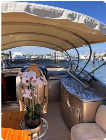
Rivarama cockpit detail