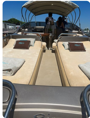
Rivarama aft sunpad