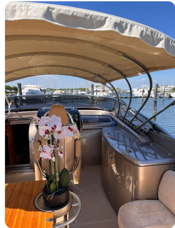
Rivarama cockpit detail