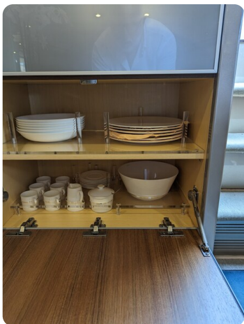
Rivarama Riva details