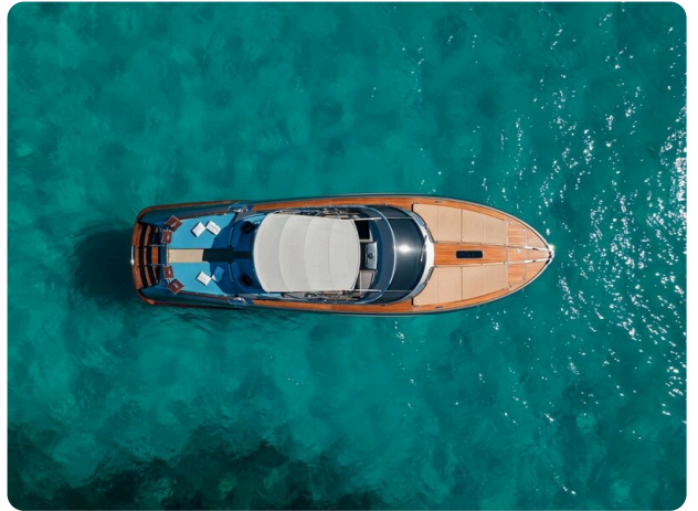
Rivarama Top View