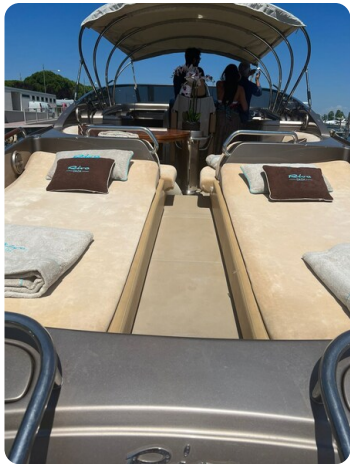
Rivarama aft sunpad