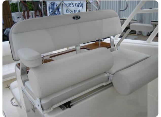
Pursuit S310 pilot seat