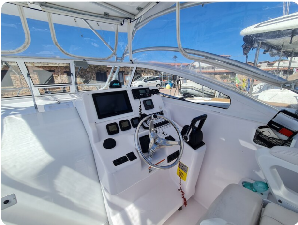
Proline 32 Express, helm station