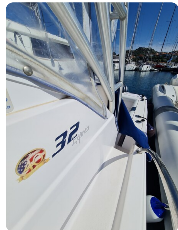
Proline 32 Express, side view