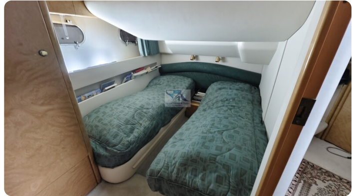
Princess 420 ARNO 45