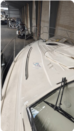
Princess 420 ARNO 47