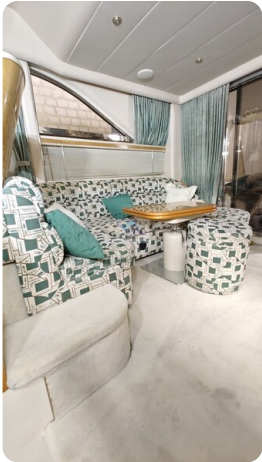
Princess 420 ARNO 28