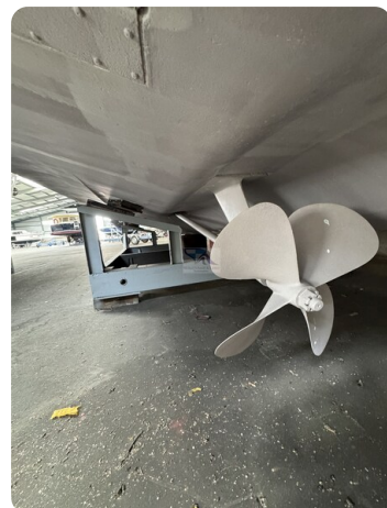
Princess 420 ARCOS 45