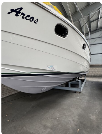
Princess 420 ARCOS 48