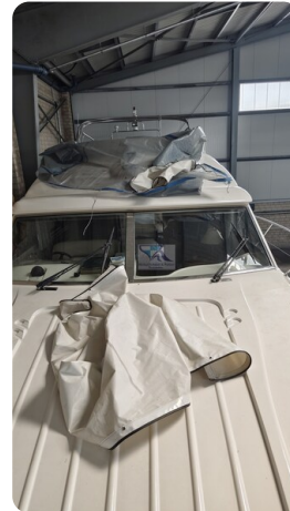
Princess 420 ARNO 49