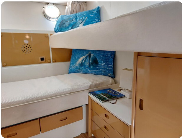
Picchiotti 68, Cabanon, cabina ospiti 1