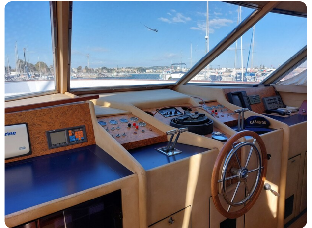
Picchiotti 68, Cabanon ponte di comando