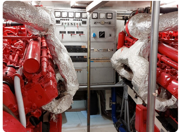
Picchiotti 68, Cabanon, sala macchine