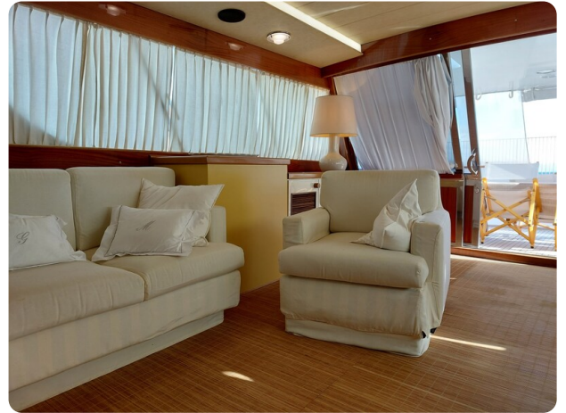
Picchiotti 68, Cabanon, salone 1