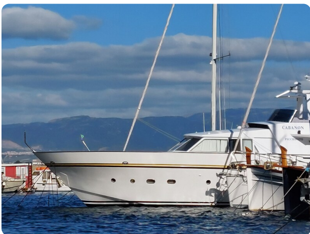
Picchiotti 68, Cabanon, profilo