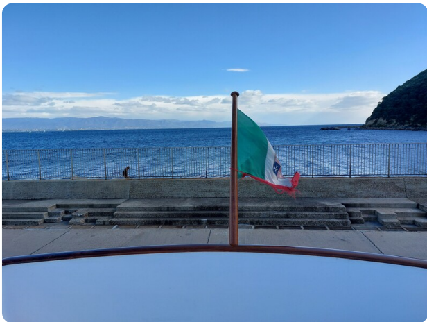
Picchiotti 68, Cabanon, flybridge det