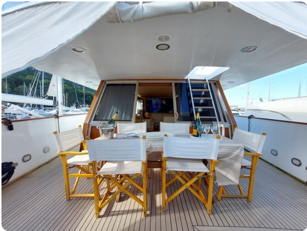
Picchiotti 68, Cabanon, dinette estrena