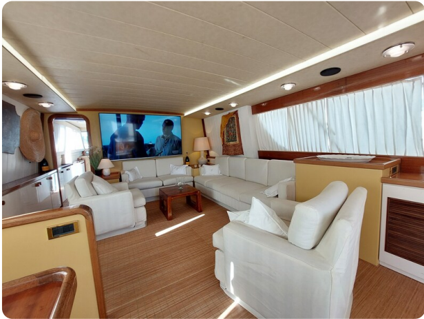
Picchiotti 68, Cabanon, salone