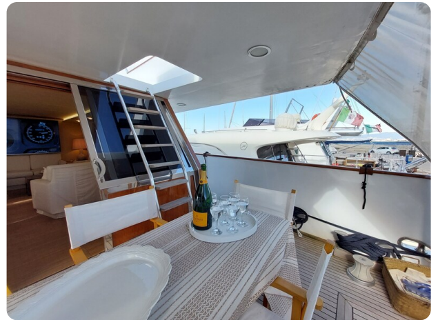
Picchiotti 68, Cabanon, esterno