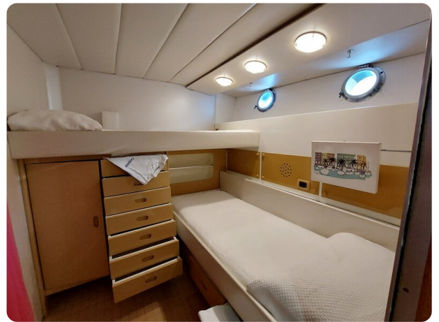
Picchiotti 68, Cabanon, cabina ospiti 2