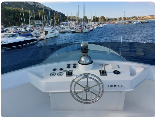
Picchiotti 68, Cabanon, flybridge postazione di guida