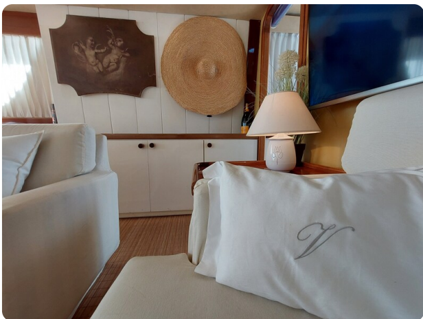
Picchiotti 68, Cabanon, salone dettaglio