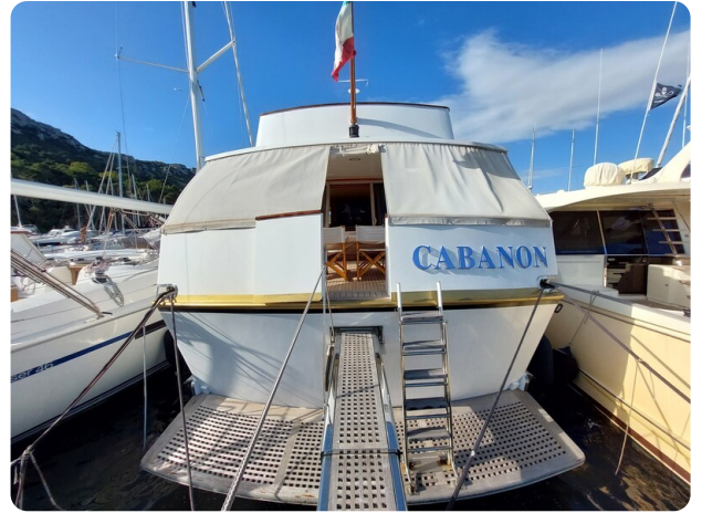
Picchiotti 68, Cabanon poppa2