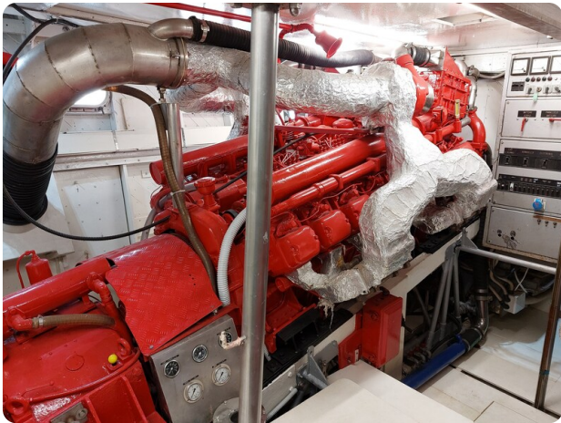
Picchiotti 68, Cabanon motore1