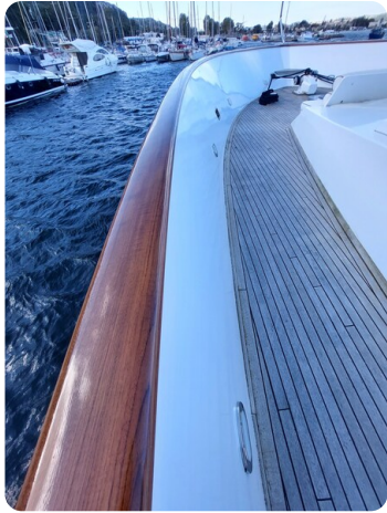
Picchiotti 68, Cabanon, dettagli teak e falchetta