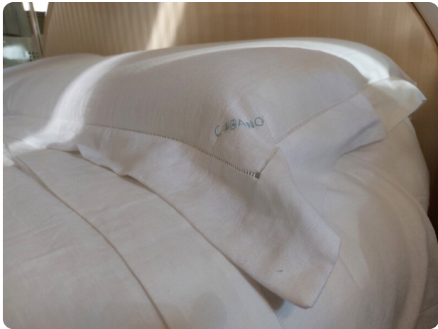
Picchiotti 68, Cabanon, corredo