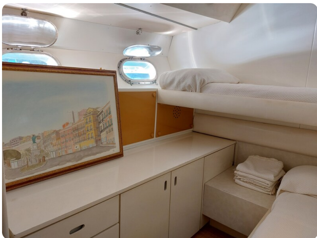
Picchiotti 68, Cabanon, cabina ospiti 3