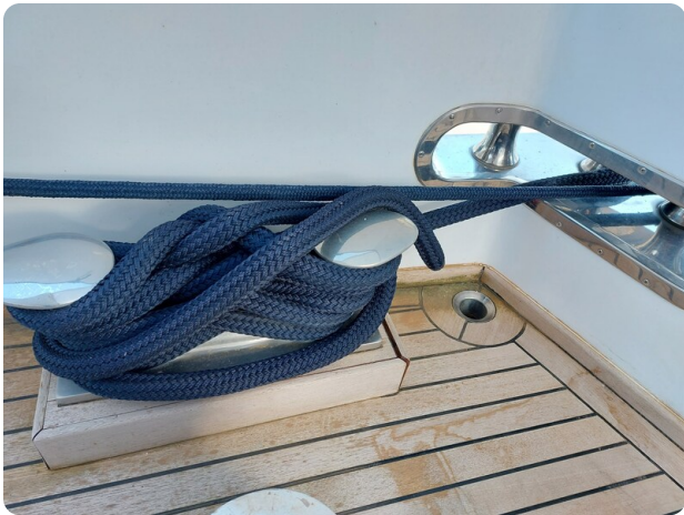
Picchiotti 68, Cabanon, dettagli