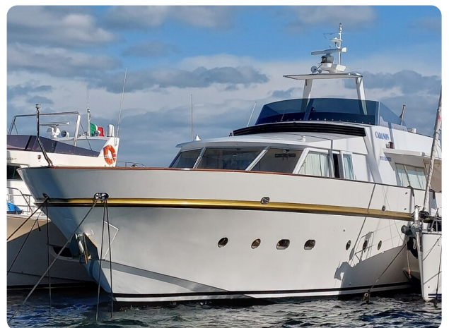
Picchiotti 68, Cabanon, vista al mascone