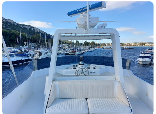
Picchiotti 68, Cabanon, flybridge dettaglio