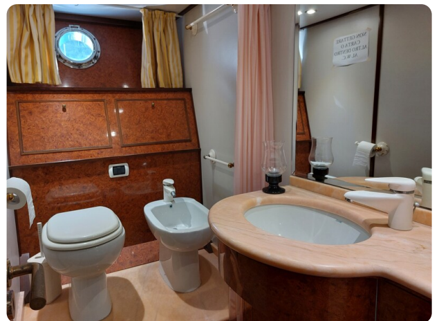
Picchiotti 68, Cabanon, wc cabina ospiti 2