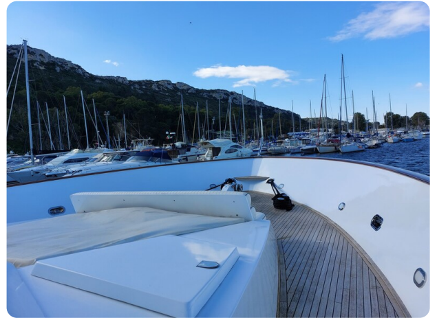
Picchiotti 68, Cabanon prua 1