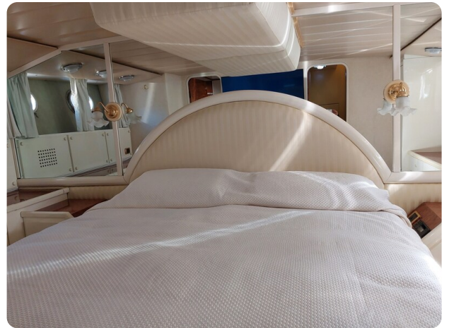
Picchiotti 68, Cabanon, cabina armatoriale