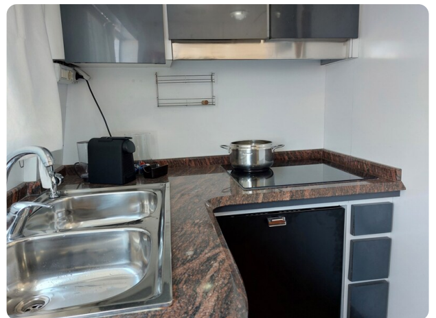
Picchiotti 68, Cabanon, cucina