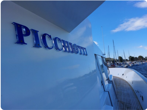
Picchiotti 68, Cabanon dettaglio