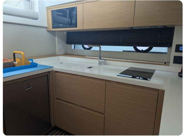
{1} Galley detail