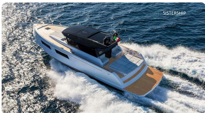
Pardo GT52 sistership