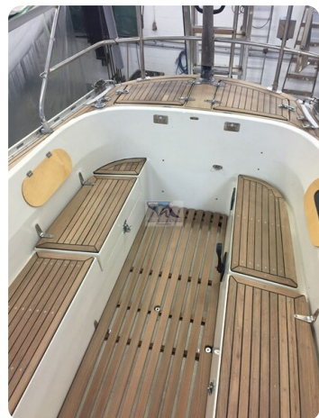
Avance 36 dL msp32