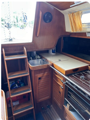
Avance 36 dL msp15