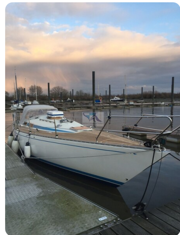
Avance 36 dL msp33