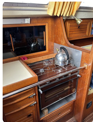
Avance 36 dL msp16