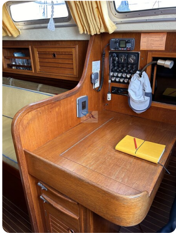
Avance 36 dL msp13