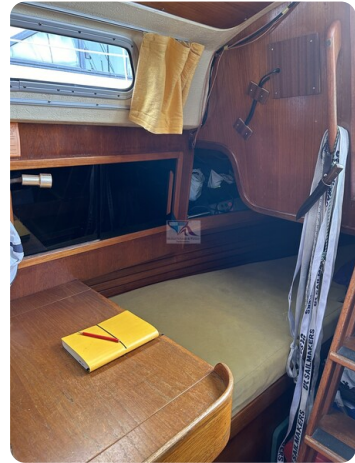
Avance 36 dL msp14