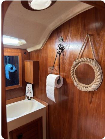
Avance 36 dL msp20