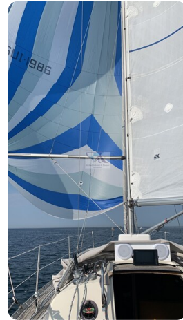
Avance 36 dL msp37