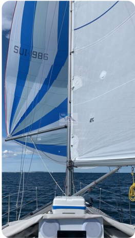
Avance 36 dL msp38