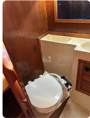
Avance 36 dL msp21