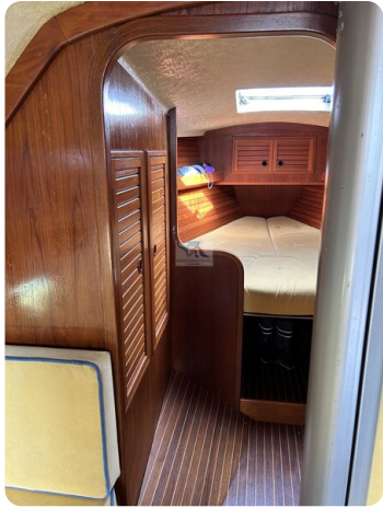
Avance 36 dL msp18