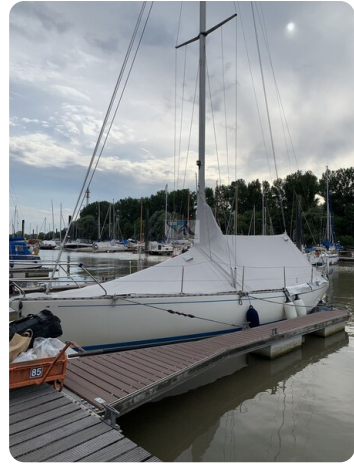
Avance 36 dL msp35