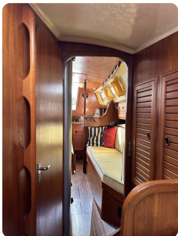
Avance 36 dL msp24