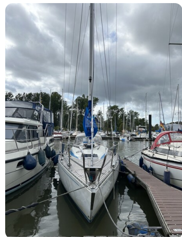
Avance 36 dL msp4