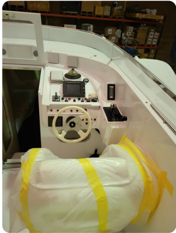
Monte Carlo 1