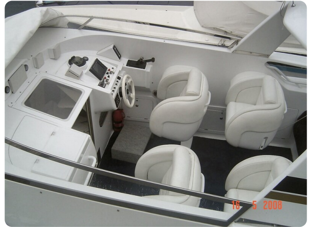
Monte Carlo 17