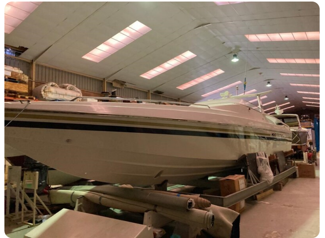
Monte Carlo 12