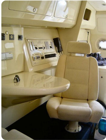
Monte Carlo 16