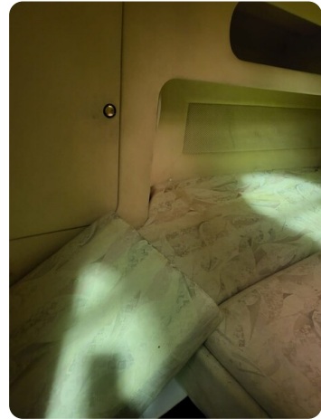
Monte Carlo 5