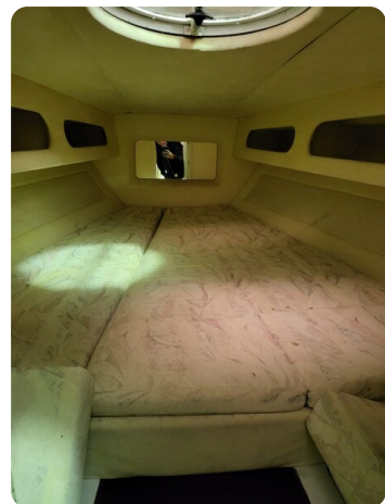
Monte Carlo 7