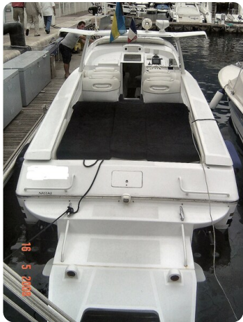
Monte Carlo 15a