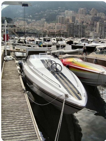
Monte Carlo 14