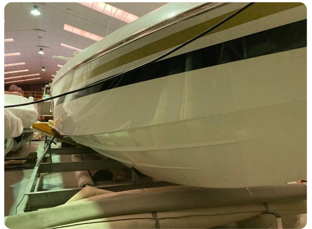
Monte Carlo 13