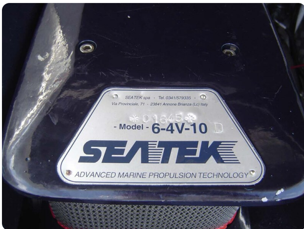
Monte Carlo 17