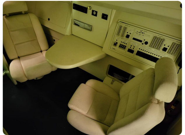
Monte Carlo 4