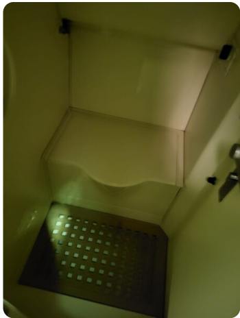
Monte Carlo 8