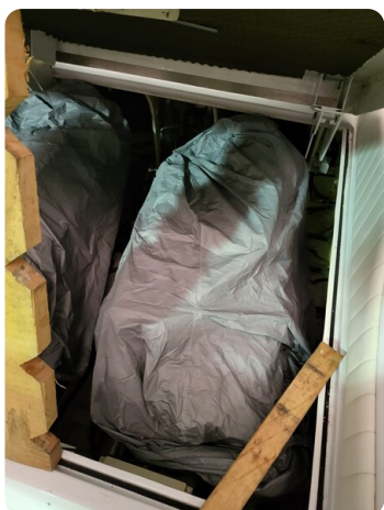
Monte Carlo 3