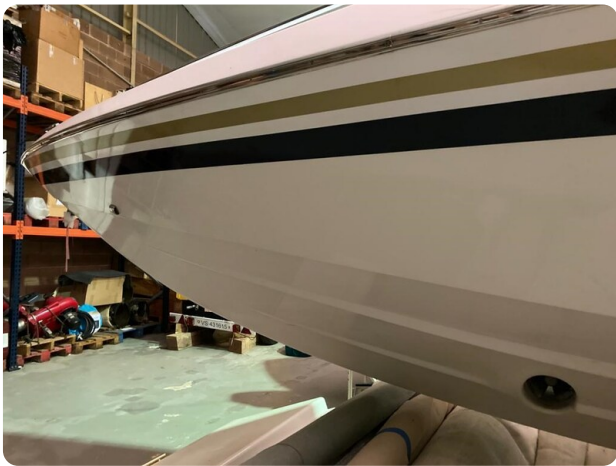
Monte Carlo 11