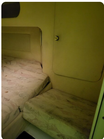
Monte Carlo 6