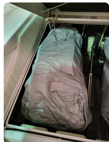
Monte Carlo 2