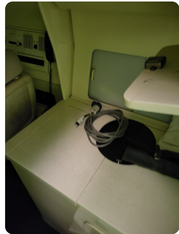
Monte Carlo 9