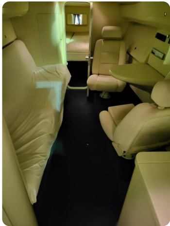
Monte Carlo 10