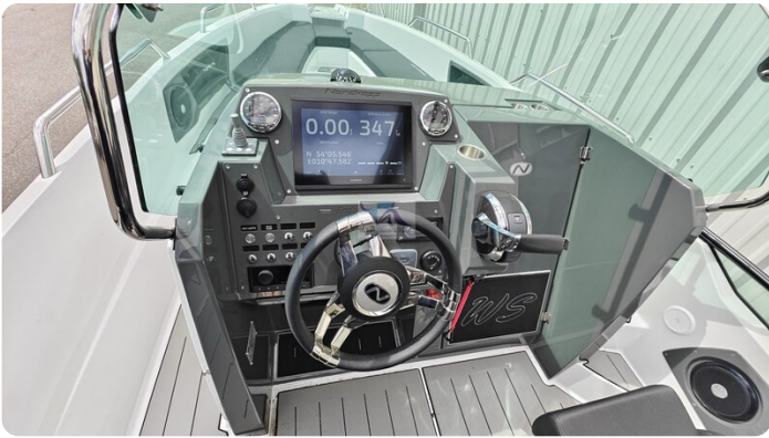
Nordkapp 705 34