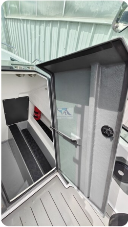
Nordkapp 705 44