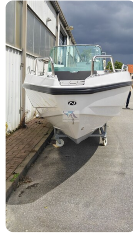
Nordkapp 705 54