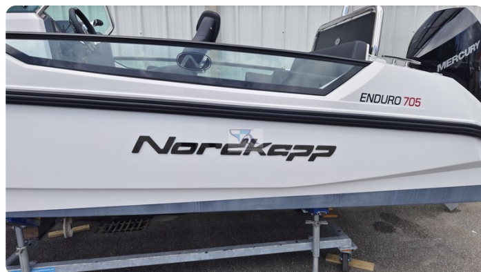
Nordkapp 705 51