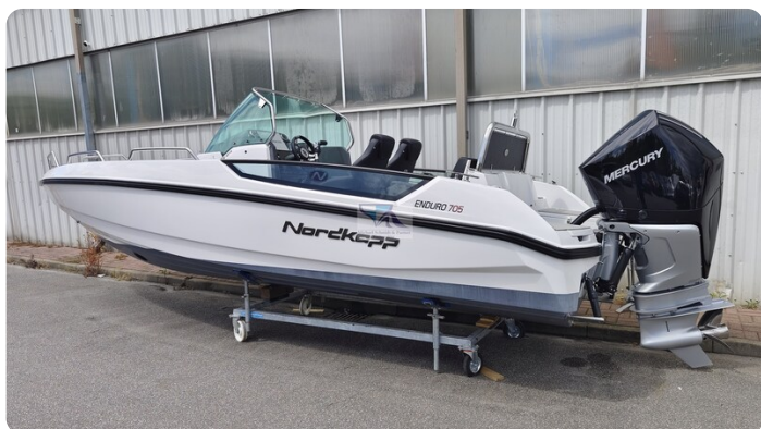
Nordkapp 705 50