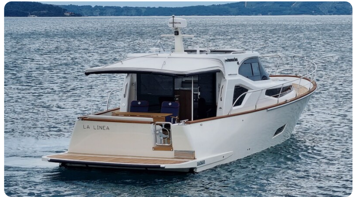
Copy of Back side