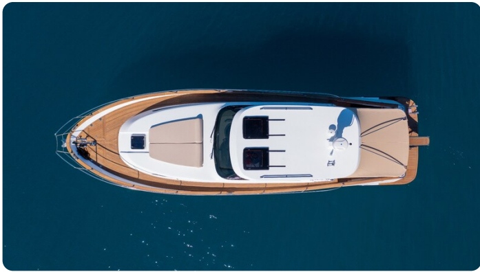
Copy of Top