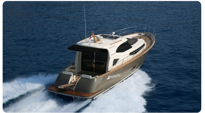
Monachus 45 SC 5