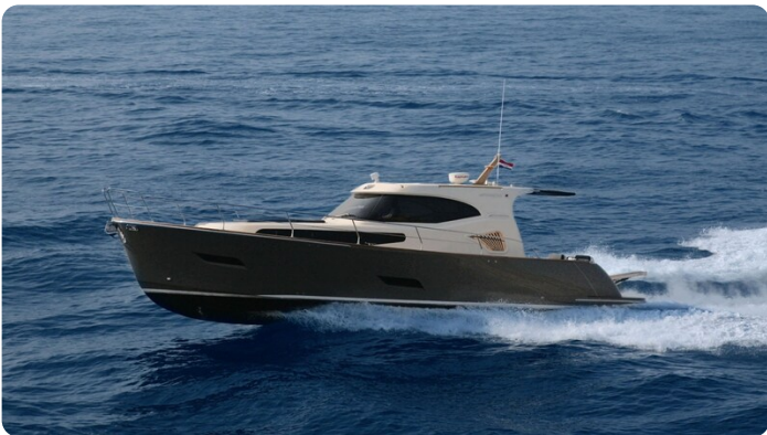
Monachus 45 SC 1