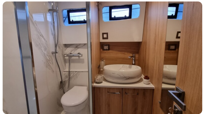
Monachus 45 SC 7