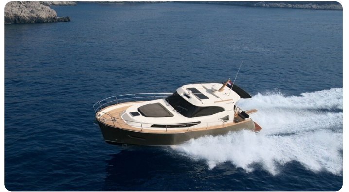
Monachus 45 SC 3