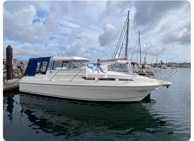
Marex 290 17