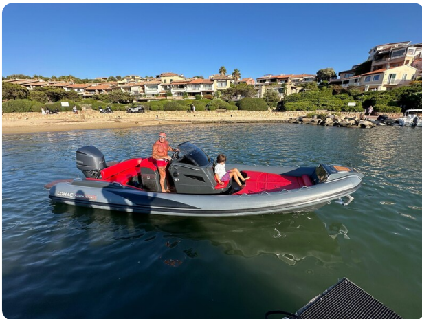
Lomac 7.50 Adrenalina view