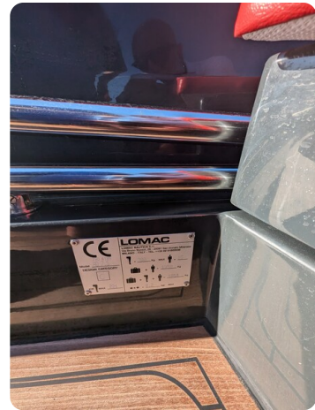
Lomac Adrenalina 7.5 CE plate