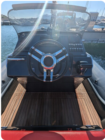
Lomac Adrenalina 7.5