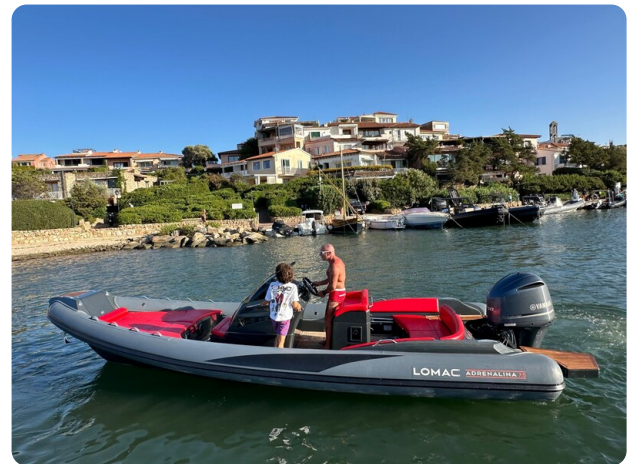
Lomac 7.50 Adrenalina profile 4