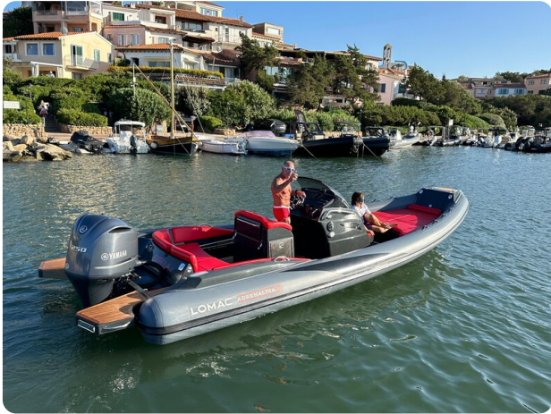
Lomac 7.50 Adrenalina aft view