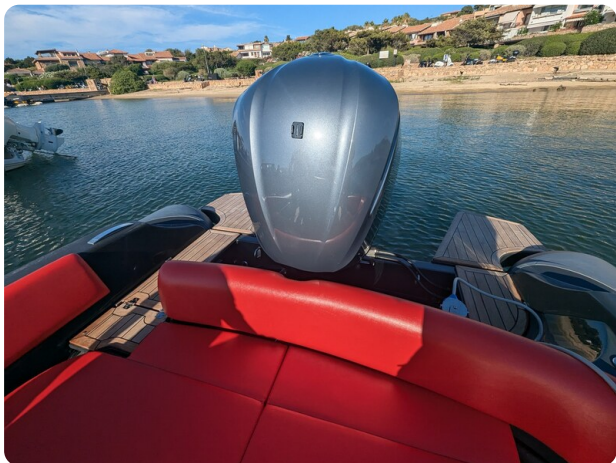
Lomac Adrenalina 7.5 stern view