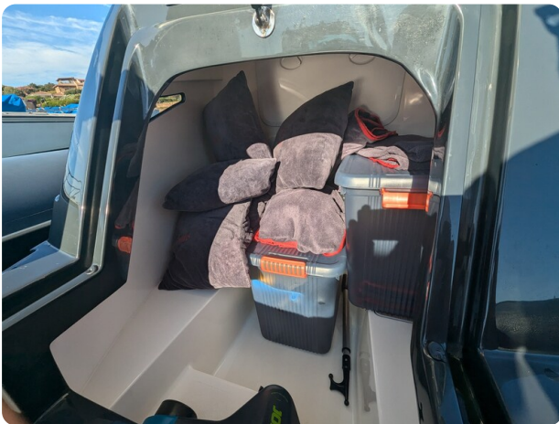
Lomac Adrenalina 7.5 storage console