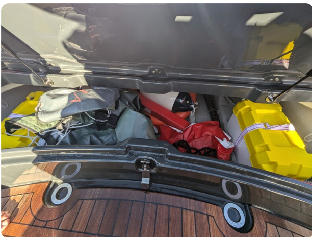
Lomac Adrenalina 7.5 storage