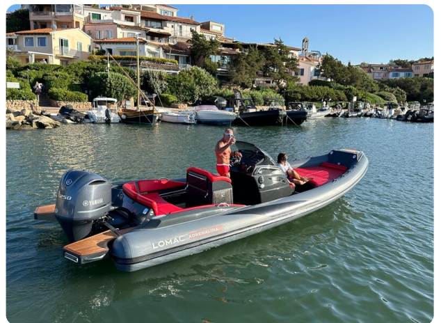
Lomac 7.50 Adrenalina aft view