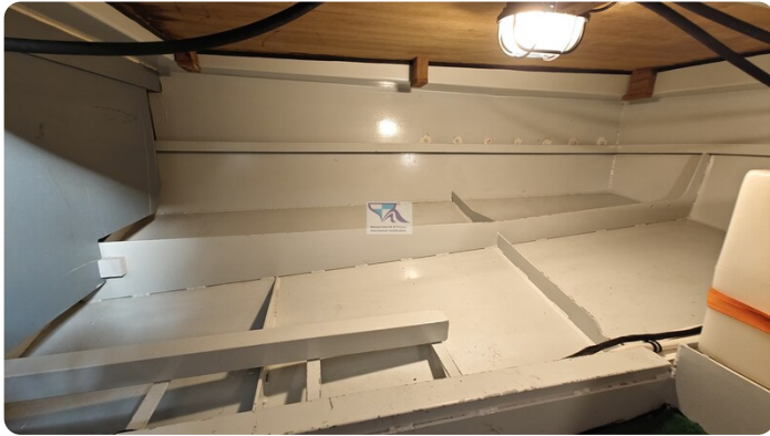
Linssen Grand Sturdy 29.9 58