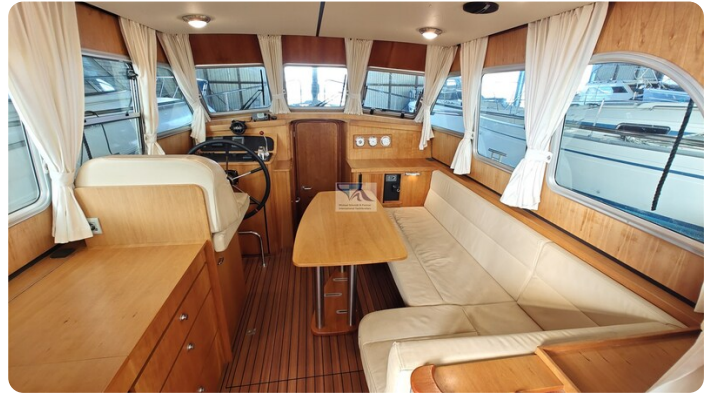
Linssen Grand Sturdy 29.9 19