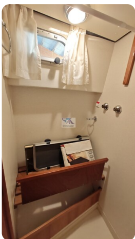
Linssen Grand Sturdy 29.9 51