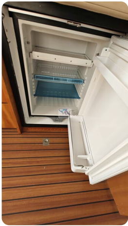
Linssen Grand Sturdy 29.9 15