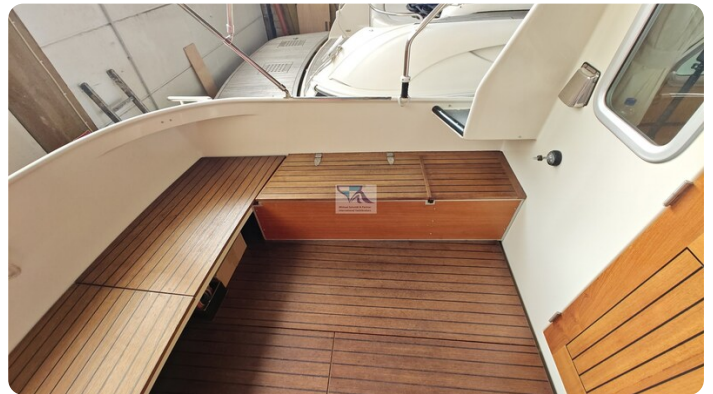
Linssen Grand Sturdy 29.9 53