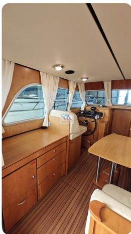
Linssen Grand Sturdy 29.9 21