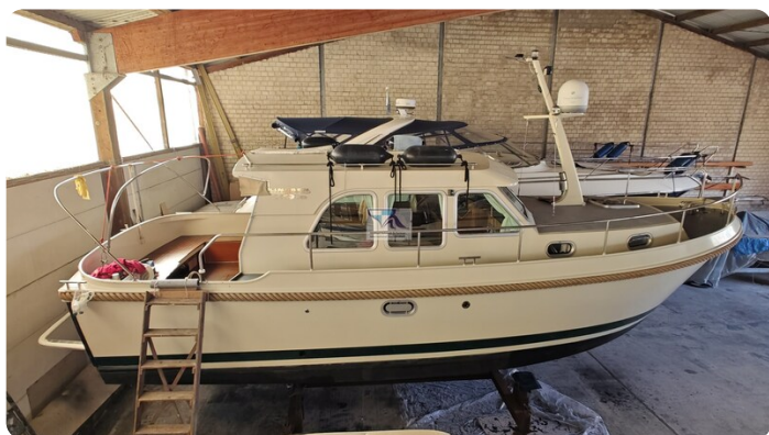
Linssen Grand Sturdy 29.9 85