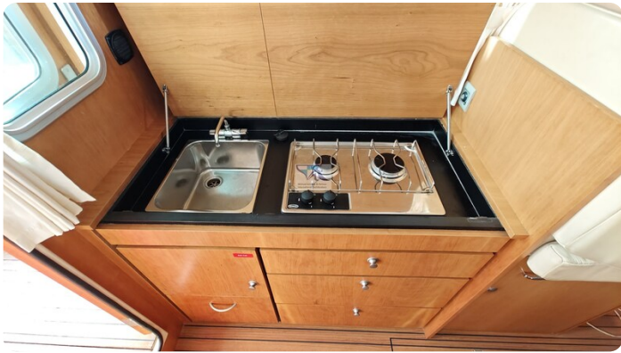
Linssen Grand Sturdy 29.9 16