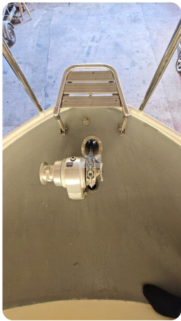
Linssen Grand Sturdy 29.9 33