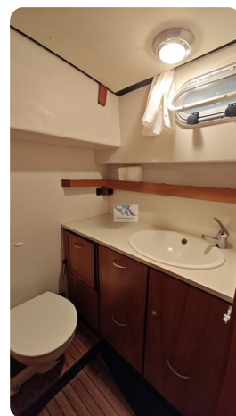
Linssen Grand Sturdy 29.9 47