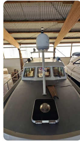
Linssen Grand Sturdy 29.9 36