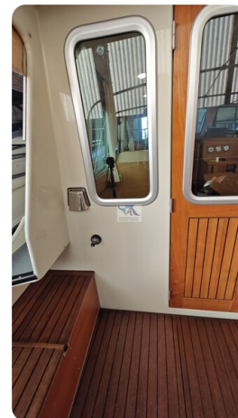
Linssen Grand Sturdy 29.9 56