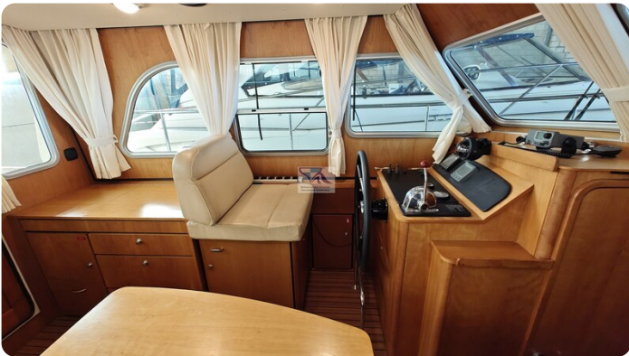
Linssen Grand Sturdy 29.9 26