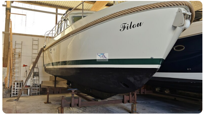
Linssen Grand Sturdy 29.9 83