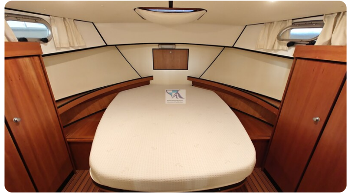
Linssen Grand Sturdy 29.9 42