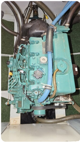
Linssen Grand Sturdy 29.9 2 - Kopie