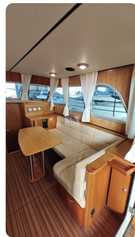
Linssen Grand Sturdy 29.9 22