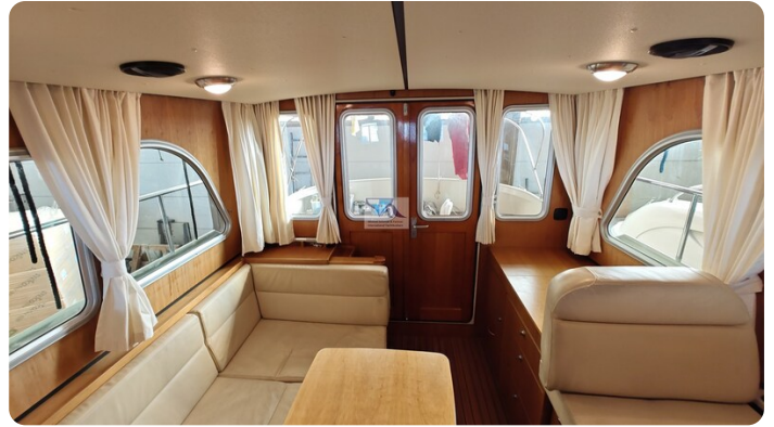
Linssen Grand Sturdy 29.9 24