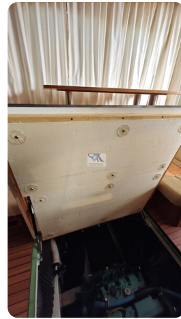
Linssen Grand Sturdy 29.9 14