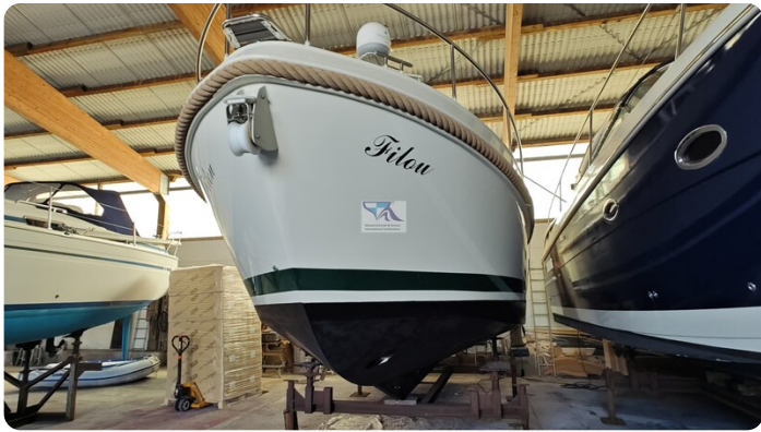
Linssen Grand Sturdy 29.9 80