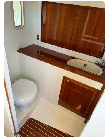
Kiel Legend 28 48