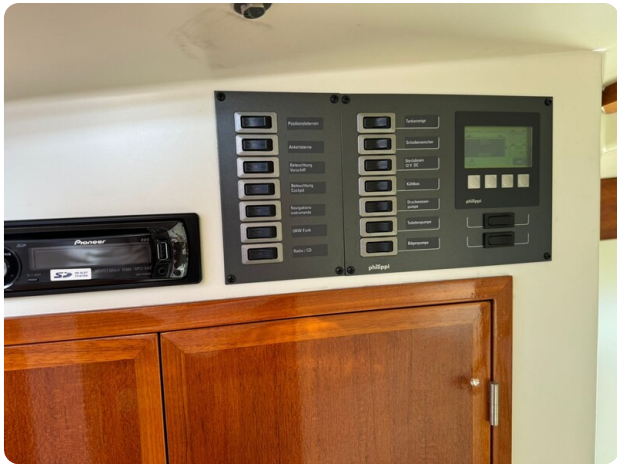
Kiel Legend 28 46