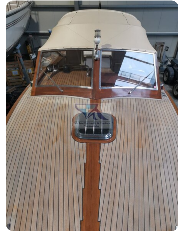
Kiel Legend 28 16