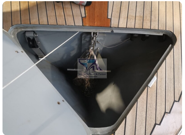
Kiel Legend 28 11