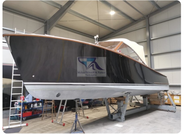
Kiel Legend 28 40