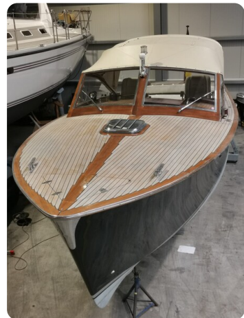
WhatsApp Bild 2025-09-05 um 09.49.47_9d1f9ad8