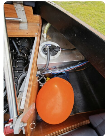
Kaiser 650 Super Sport 12