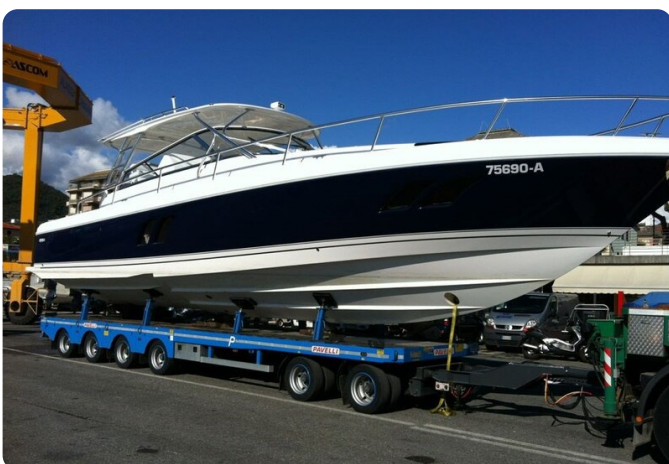
Intrepid 475 SY drydock