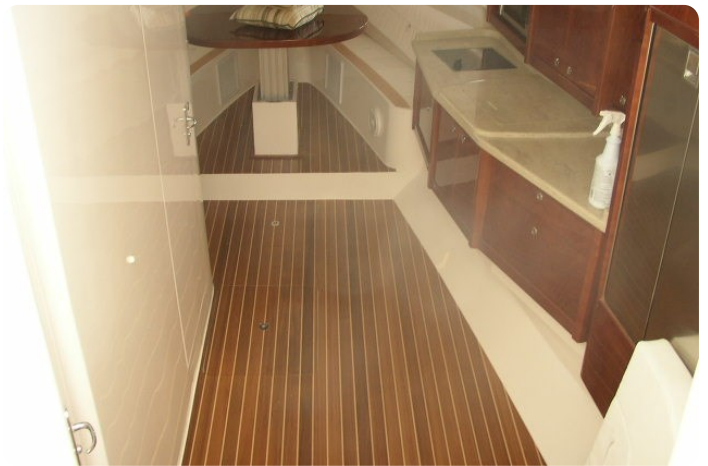
Intrepid 475 SY cabin