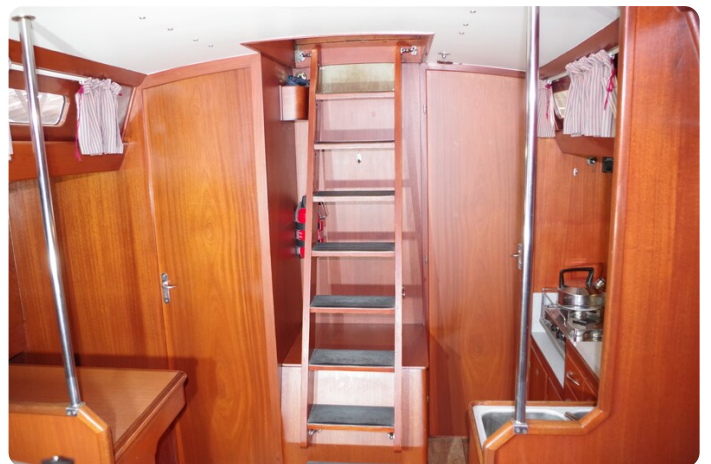
Hatecke 42 660249 77