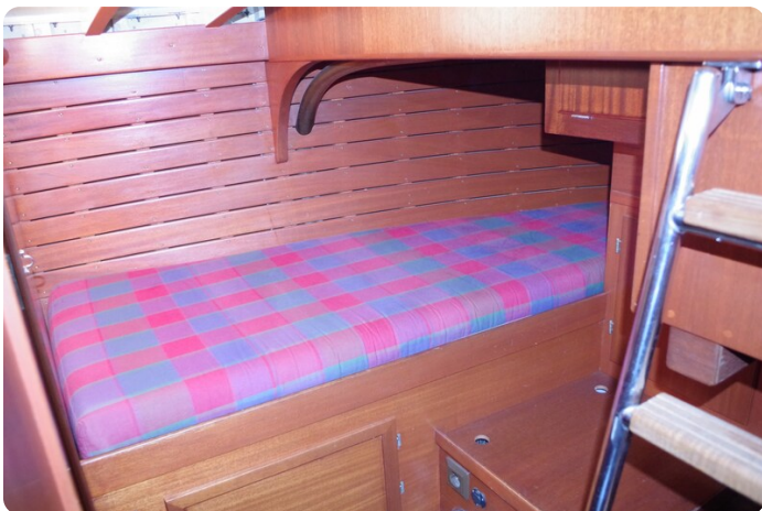
Hatecke 42 660249 110