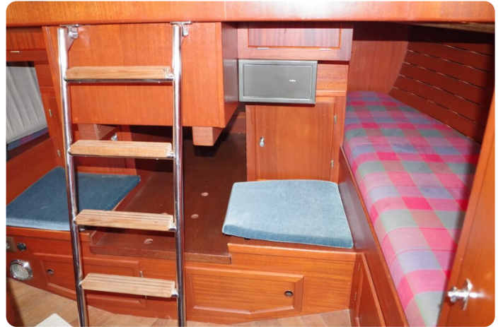
Hatecke 42 660249 116