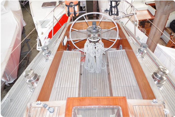
Hatecke 42 660249 35