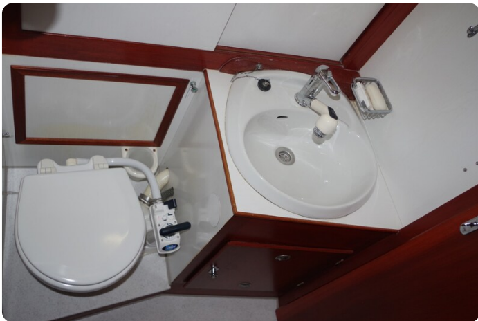
Hatecke 42 660249 42