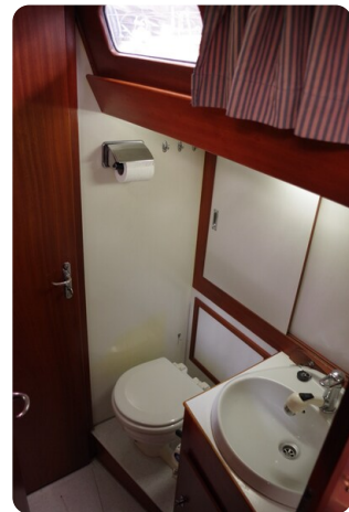
Hatecke 42 660249 46