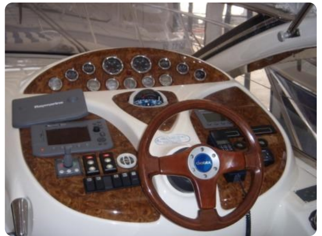
Gobbi 425 (3)