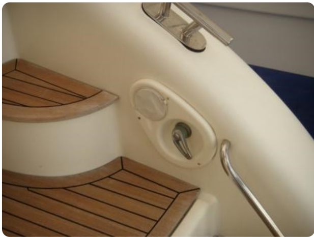
Gobbi 425 esterno (7)