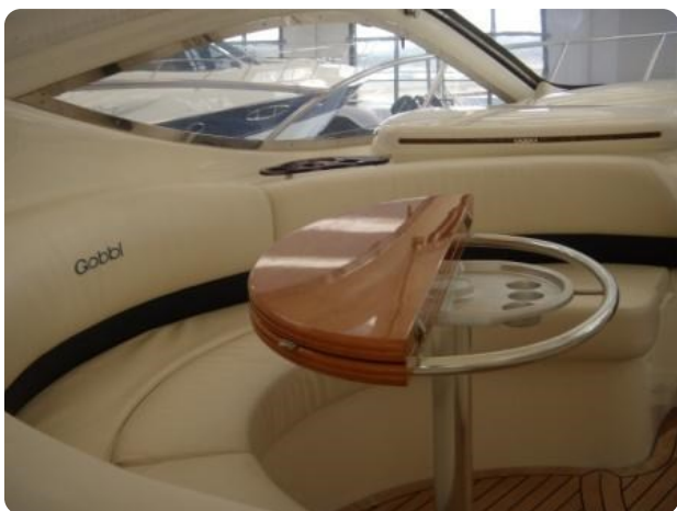
Gobbi 425 (6)