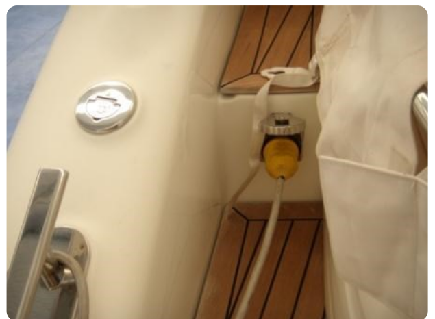
Gobbi 425 esterno (8)