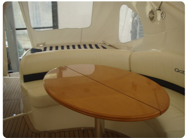
Gobbi 425 (1)