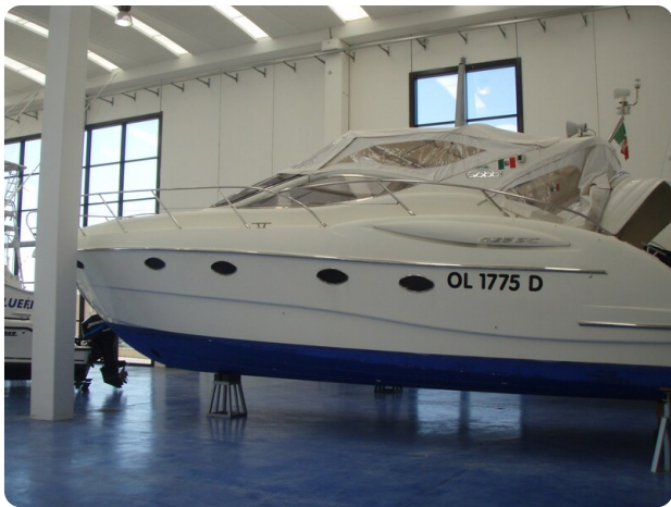
Gobbi 425 esterno