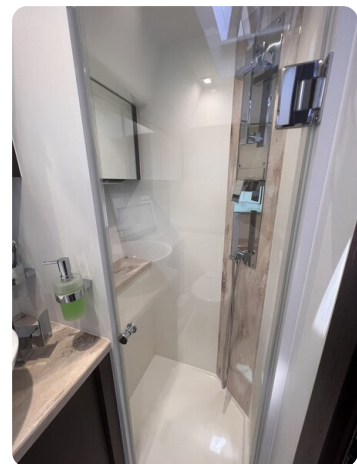
Galeon 485 HTS shower