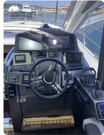
Galeon 485 HTS helm