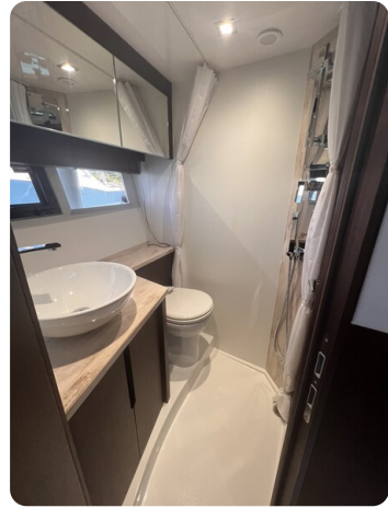
Galeon 485 HTS bathroom