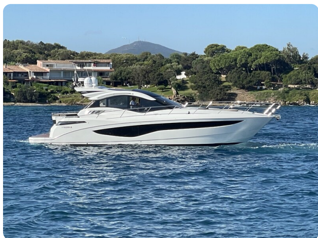
Galeon 485 HTS profile