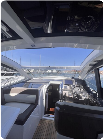
Galeon 485 HTS upper dinette