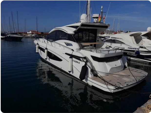
Galeon 485 HTS aft profile