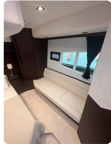
Galeon 485 HTS master cabin detail