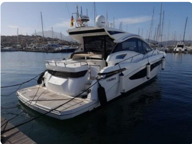
Galeon 485 4