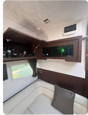
Galeon 485 HTS dinette detail