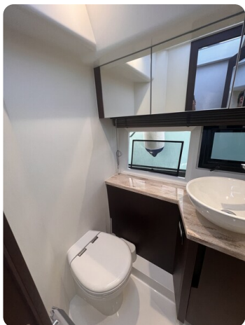
Galeon 485 HTS head