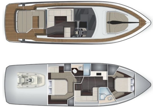
Galeon 485 HTS layout