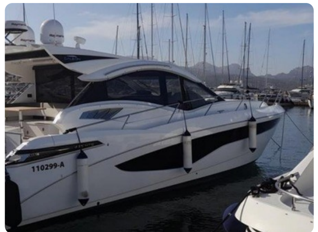
Galeon 485 HTS side detail