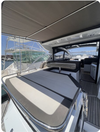
Galeon 485 HTS cockpit sunpad