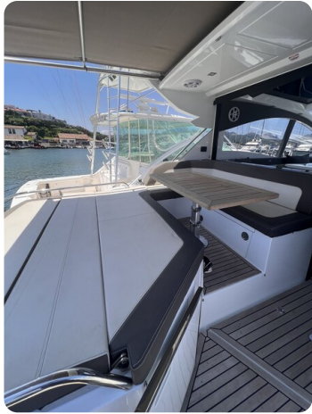
Galeon 485 HTS cockpit dinette