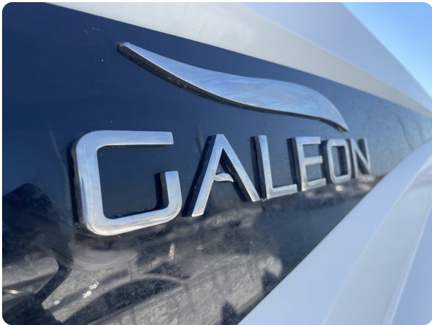
Galeon 485 HTS logo