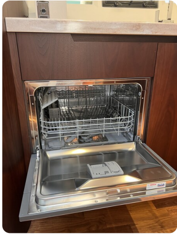
Galeon 485 HTS dishwasher