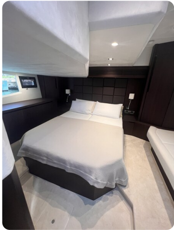
Galeon 485 HTS master cabin