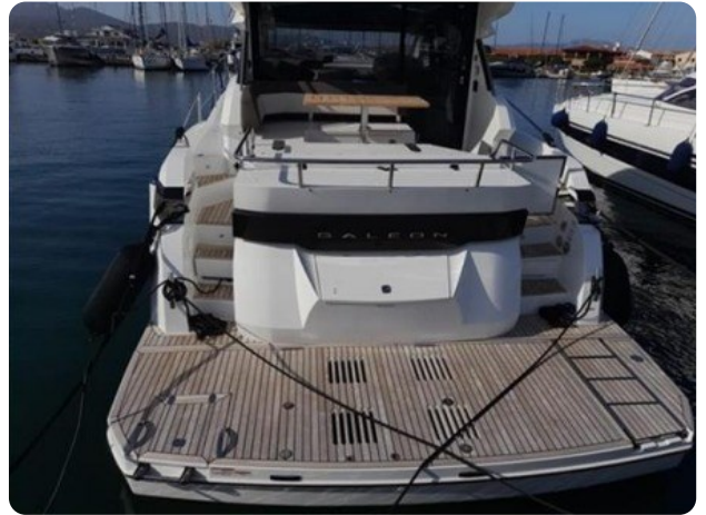
Galeon 485 5