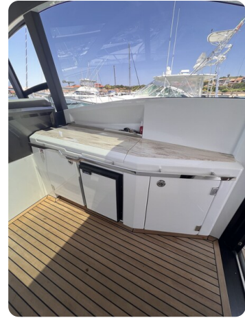
Galeon 485 HTS cockpit detail