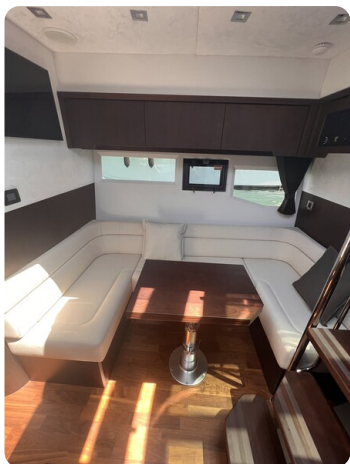
Galeon 485 HTS dinette