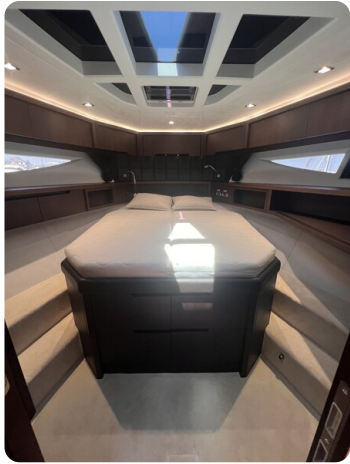
Galeon 485 HTS Vip cabin