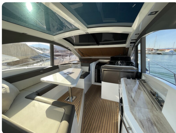
Galeon 485 HTS ext dinette