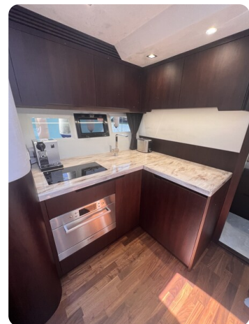
Galeon 485 HTS galley