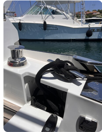
Galeon 485 HTS cockpit winch