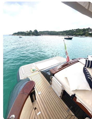
Franchini 55 Emozione