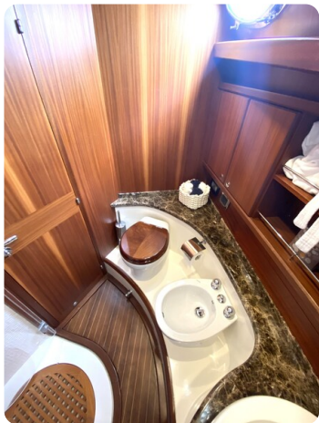
Franchini 55 Emozione