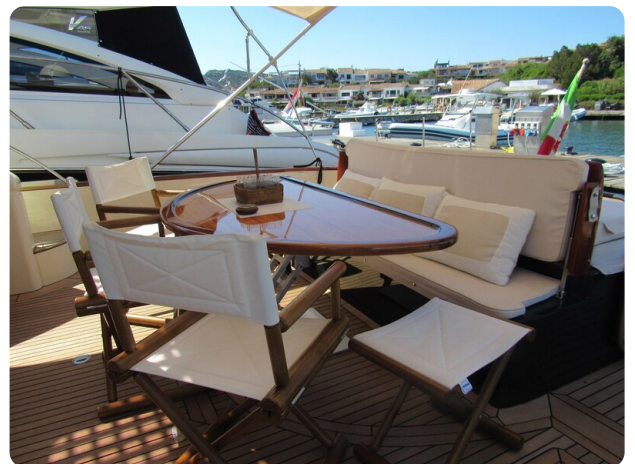
Franchini 55 Emozione, cockpit dinette detail