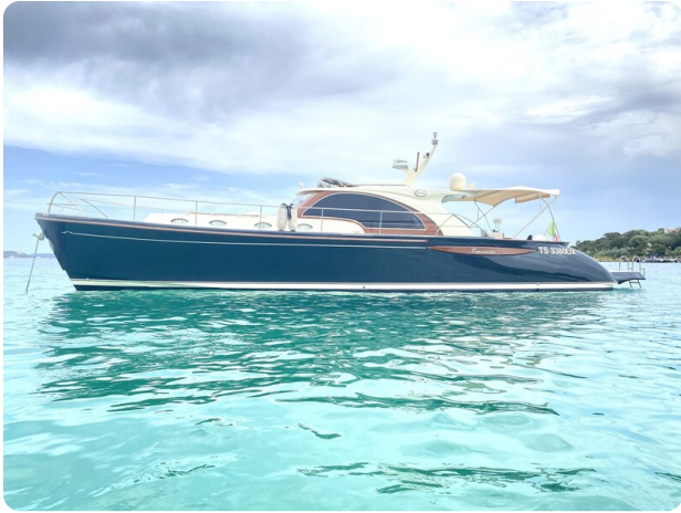
Franchini 55 Emozione