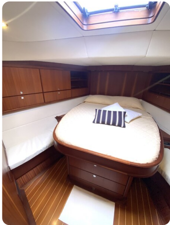
Franchini 55 Emozione