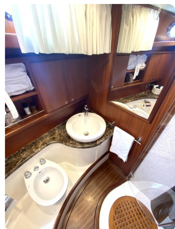
Franchini 55 Emozione