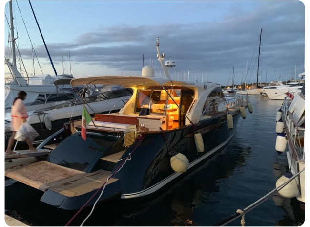
Franchini 55, sunset