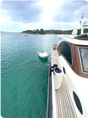
Franchini 55 Emozione