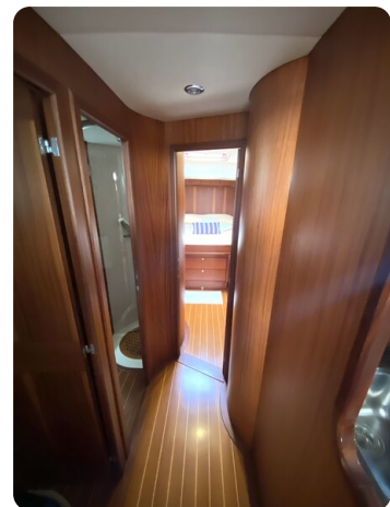
Franchini 55 Emozione