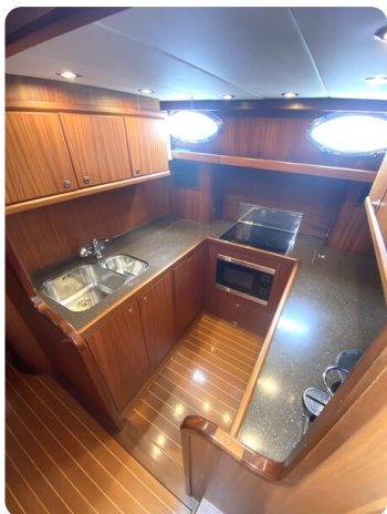
Franchini 55 Emozione