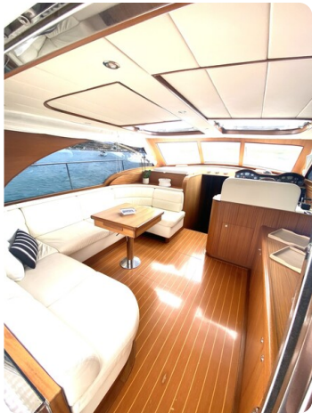
Franchini 55 Emozione