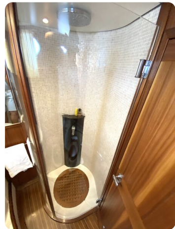
Franchini 55 Emozione