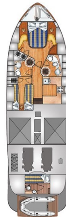
Franchini 55 lower layout