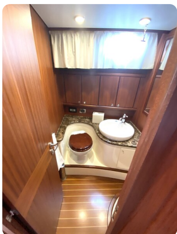
Franchini 55 Emozione