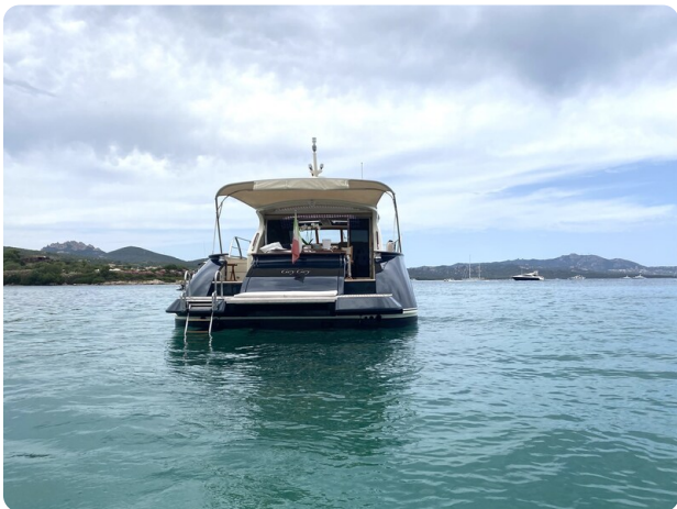
Franchini 55 Emozione aft view