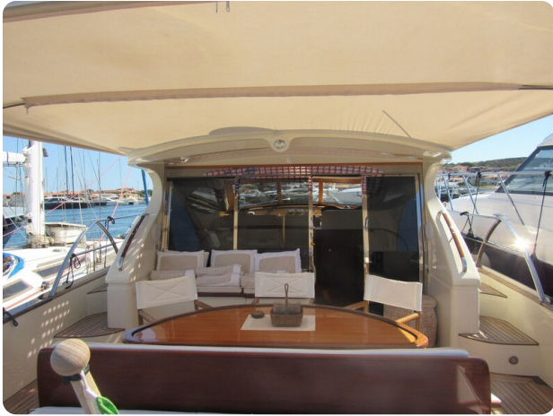
Franchini 55 Emozione, cockpit view to fwd