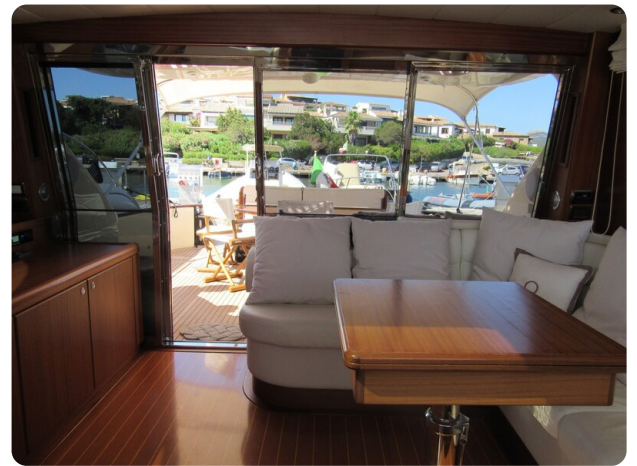
Franchini 55 Emozione, salon to aft