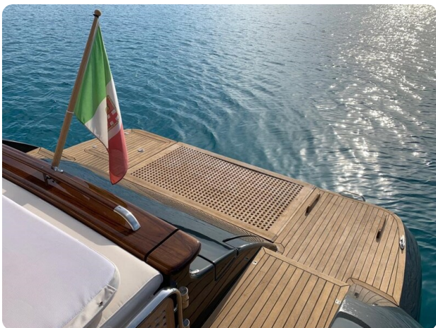
Franchini 55, swim platform