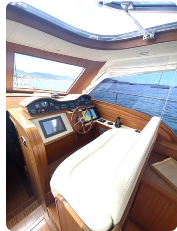
Franchini 55 Emozione