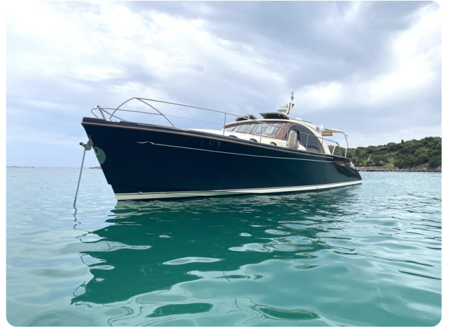
Franchini 55 Emozione bow profile