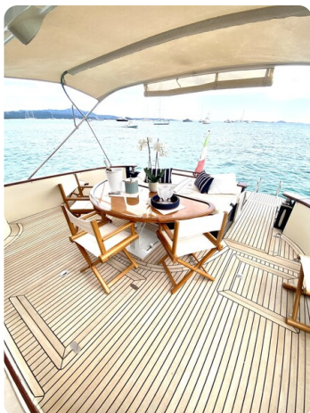
Franchini 55 Emozione