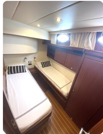
Franchini 55 Emozione