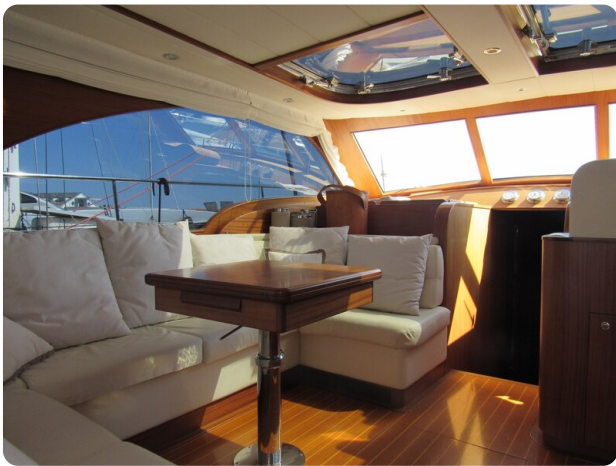
Franchini 55 Emozione, dinette