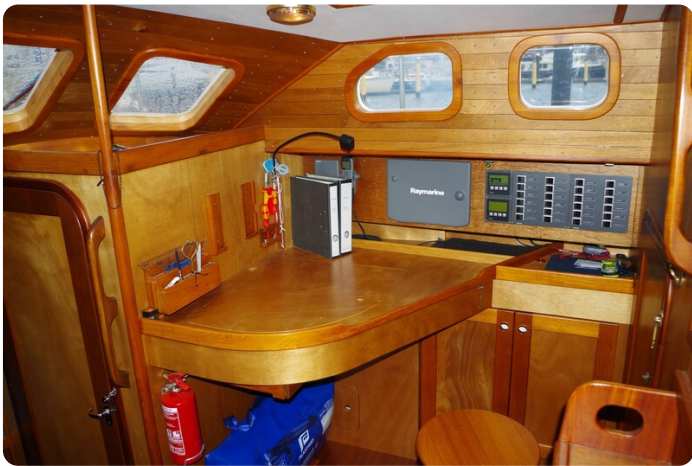
Skorpion II ESTRELLA 27