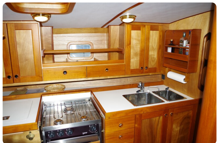
Skorpion II ESTRELLA 45