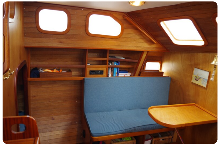
Skorpion II ESTRELLA 31