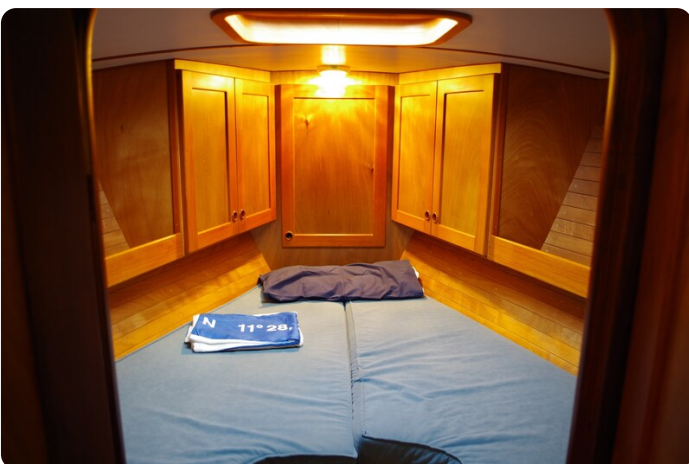
Skorpion II ESTRELLA 42