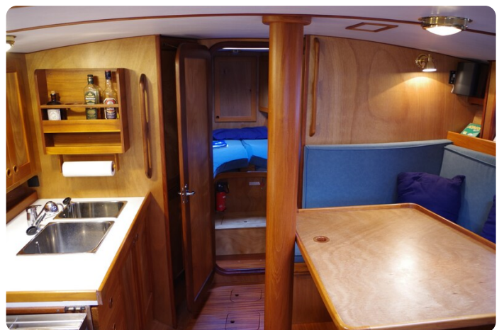
Skorpion II ESTRELLA 34