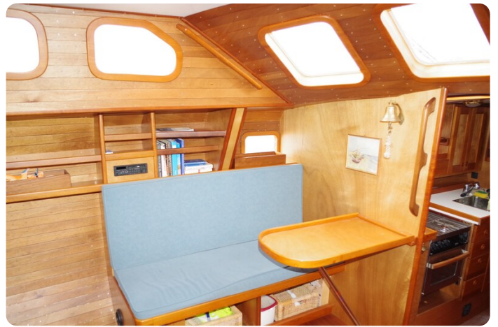
Skorpion II ESTRELLA 26