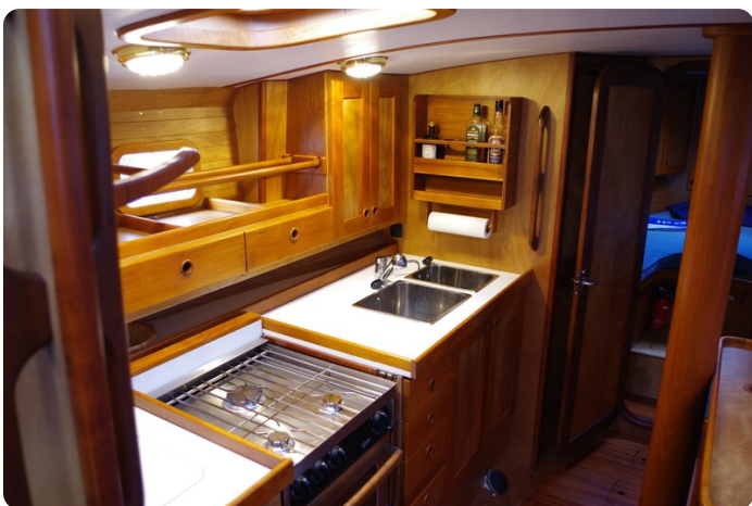
Skorpion II ESTRELLA 33