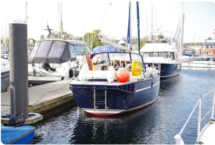
SKORPION II ESTRELLA 1