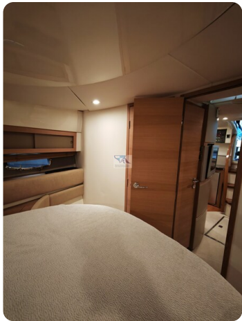
Fairline Targa 38 27