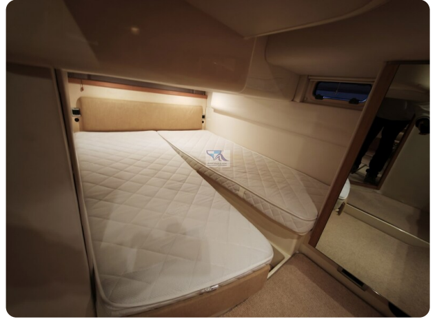
Fairline Targa 38 41