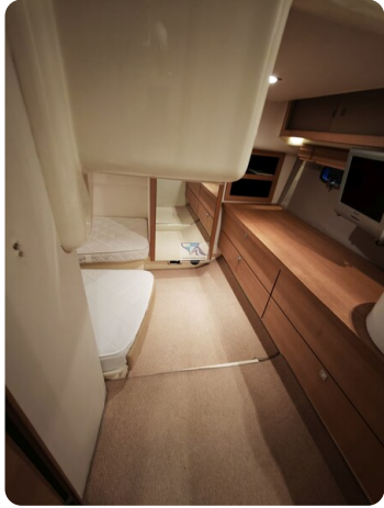
Fairline Targa 38 40