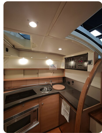
Fairline Targa 38 7