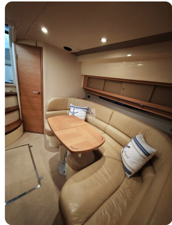
Fairline Targa 38 29