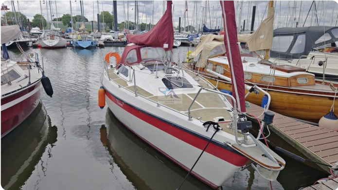
Etap 23i 22