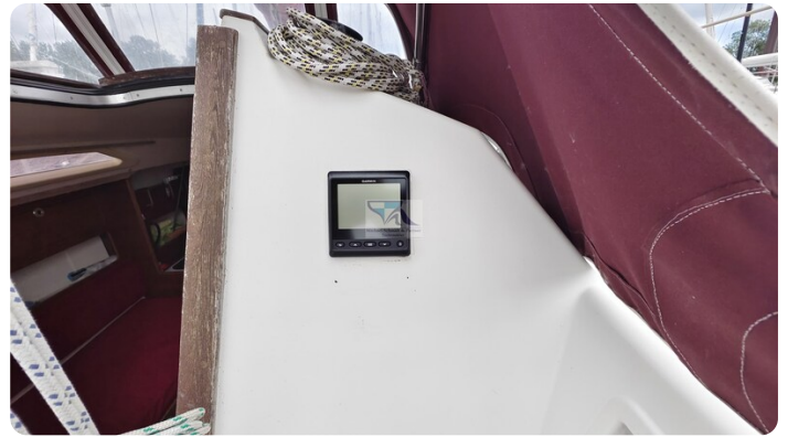
Etap 23i 28