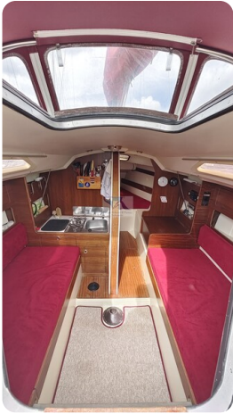
Etap 23i 15