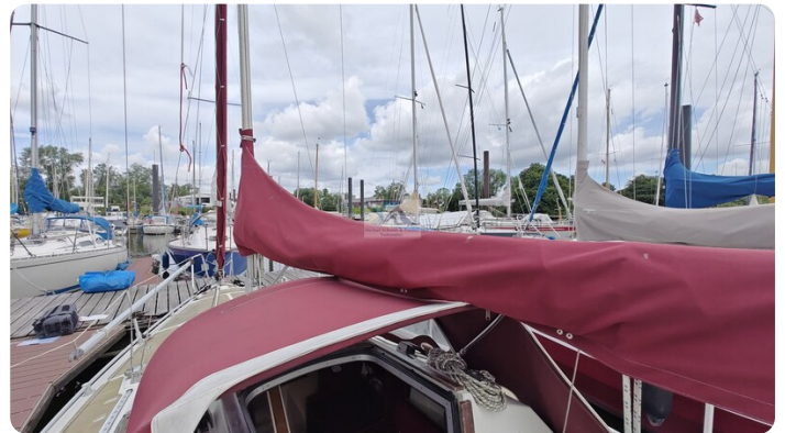
Etap 23i 29