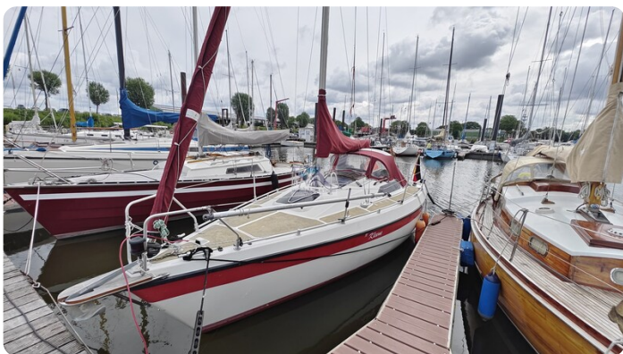
Etap 23i 20