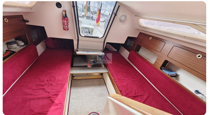
Etap 23i 13