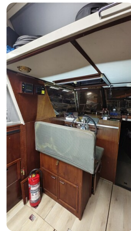
Reinke Tourina 10m_37