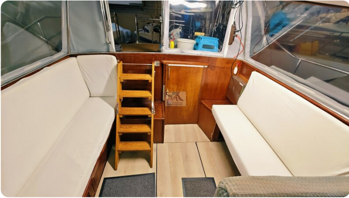
Reinke Tourina 10m_68