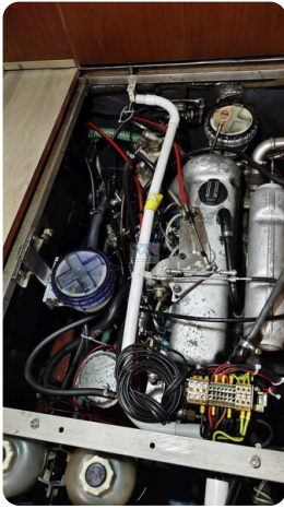
Reinke Tourina 10m_51