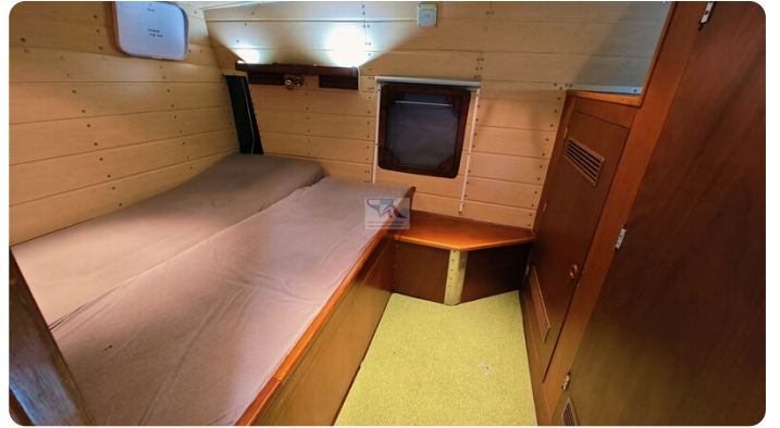
Reinke Tourina 10m_75