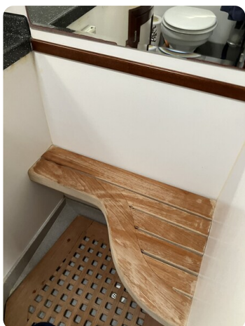
Liberty 35 Shower