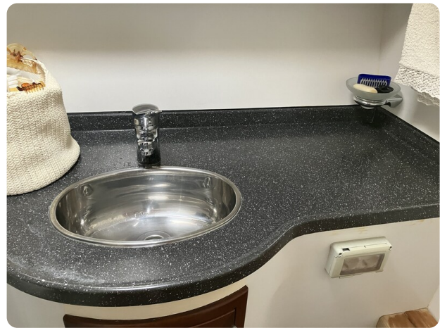
Liberty 35 Head