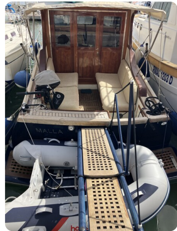
Liberty 35 Stern View