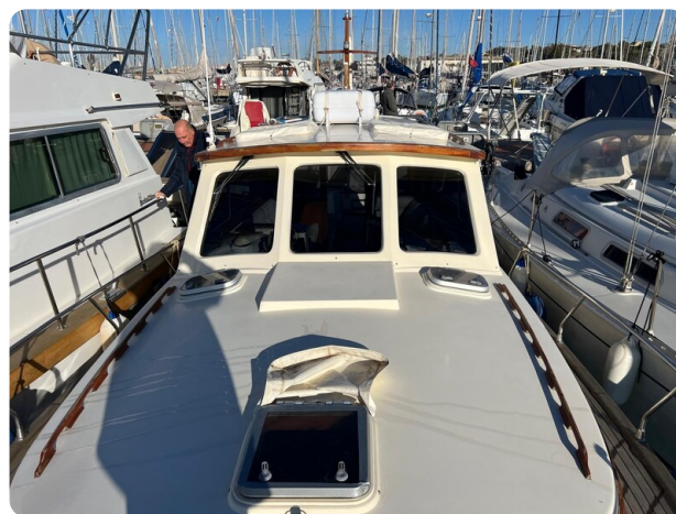
Liberty 35 fwd deck