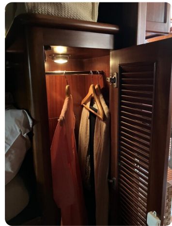
Liberty 35 interiors