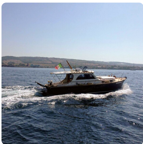
Liberty 35 Profile