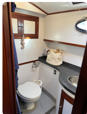
Liberty 35 head