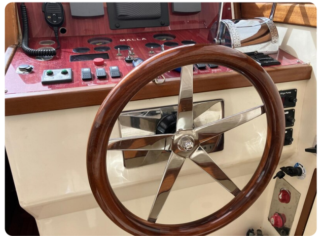
Liberty 35 rudder detail