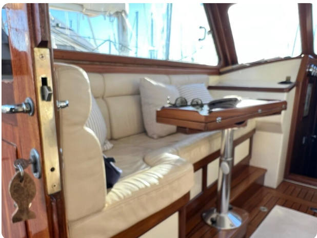
Liberty 35 dinette