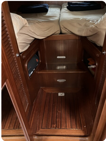
Liberty 35 Cabin Detail