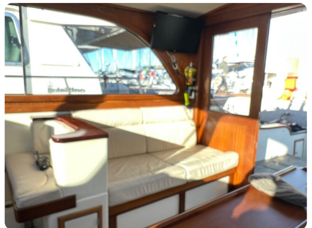
Liberty 35 salon detail