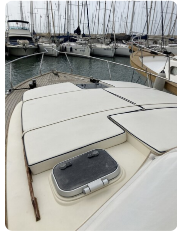
Liberty 35 Bow Sunpad