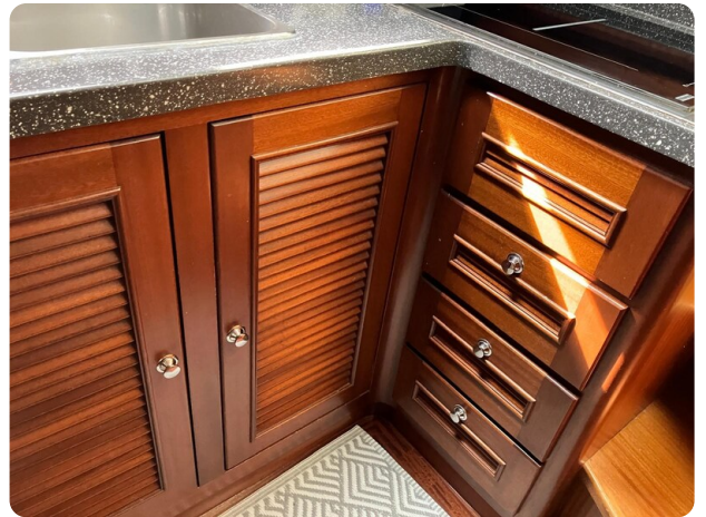
Liberty 35 galley detail