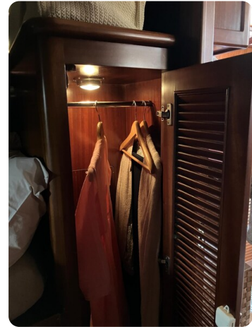
Liberty 35 interiors