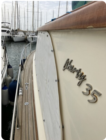
Liberty 35 Detail