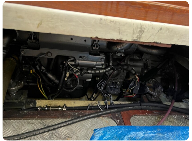
Liberty 35 engine room