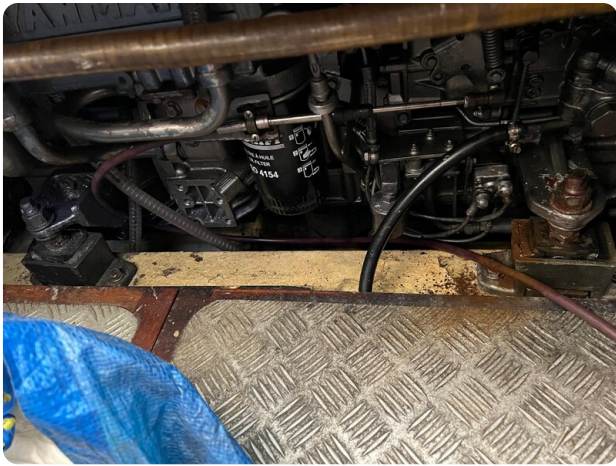
Liberty 35 engine room view