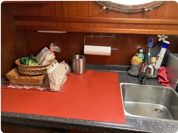
Liberty 35 galley