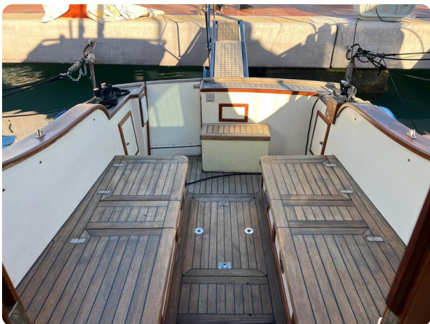
Liberty 35 cockpit view