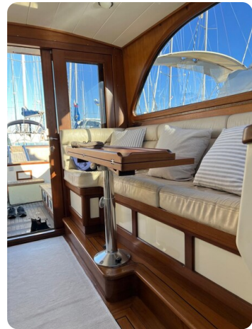
Liberty 35 dinette detail