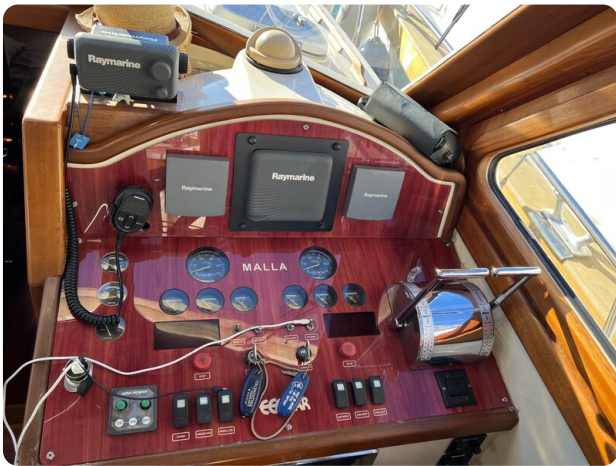
Liberty 35 helm