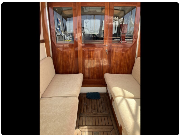
Liberty 35 Cockpit