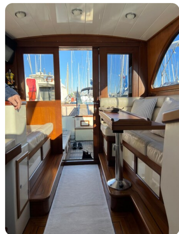
Liberty 35 salon