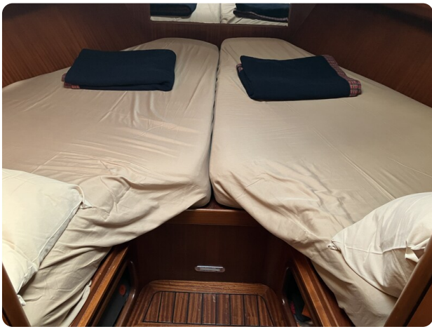
Liberty 35 Cabin