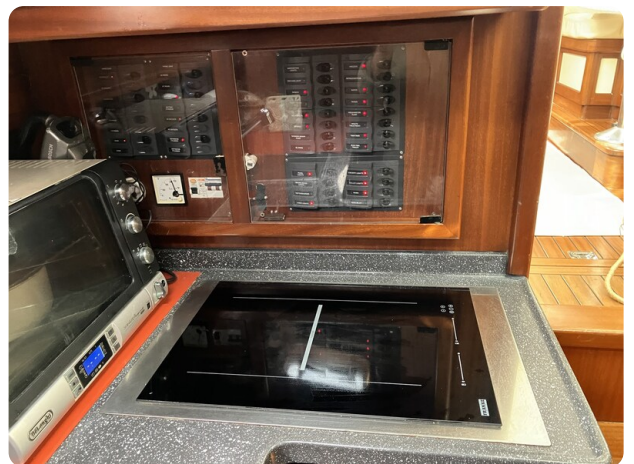
Liberty 35 Cockpit Galley Detail