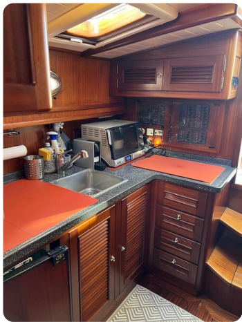
Liberty 35 galley overview