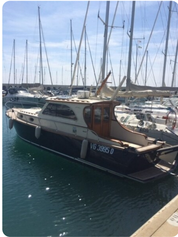
Liberty 35 Aft Profile Detail