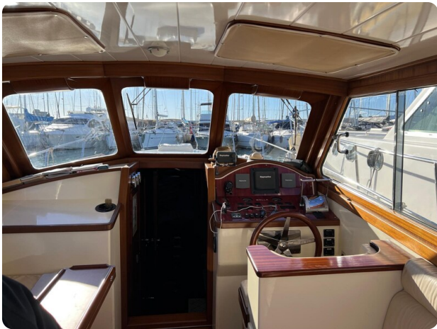
Liberty 35 helm station