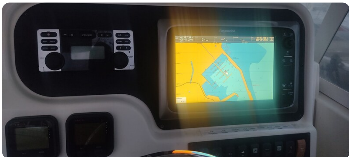
Edge Water 265 ex-14