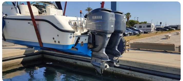
Edge Water 265 ex-7