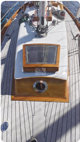
6 KR De Dood 6