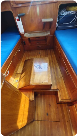
6 KR De Dood 18