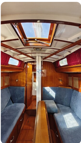
6 KR De Dood 22