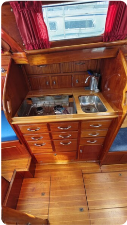
6 KR De Dood 19