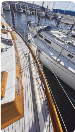
6 KR De Dood 9