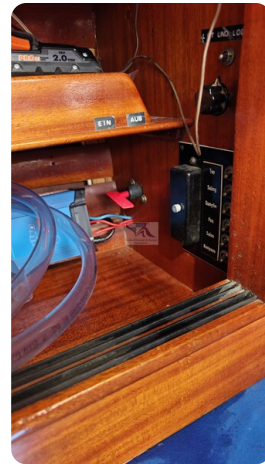
6 KR De Dood 45