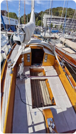
6 KR De Dood 52