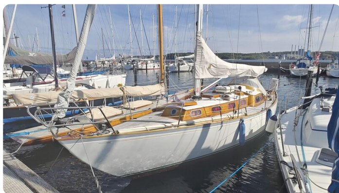
6 KR De Dood 4