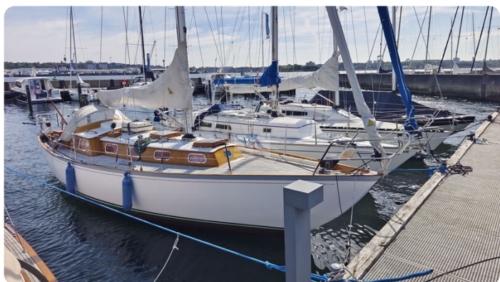
6 KR De Dood 1