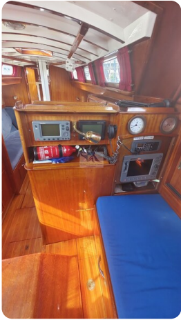
6 KR De Dood 14