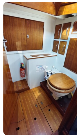
6 KR De Dood 23