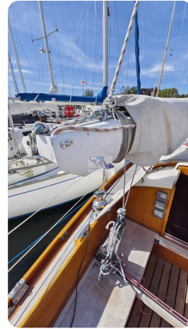
6 KR De Dood 55