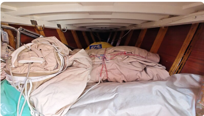
6 KR De Dood 27