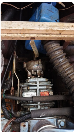
6 KR De Dood 40