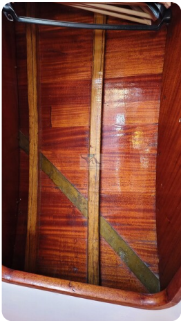
6 KR De Dood 25