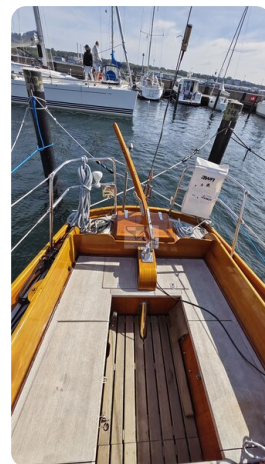
6 KR De Dood 49