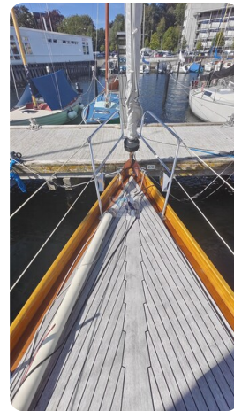
6 KR De Dood 7