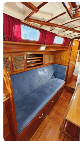
6 KR De Dood 21