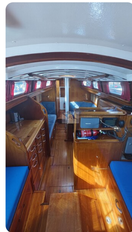
6 KR De Dood 12