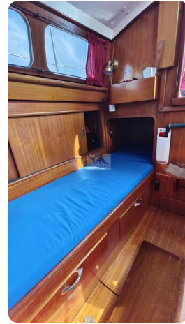
6 KR De Dood 16