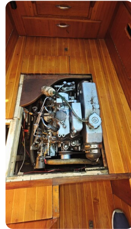
6 KR De Dood 36