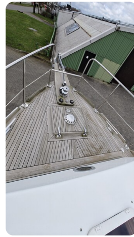
Spitzgatt Kutter LADY 5