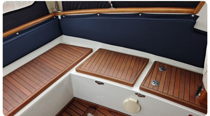
Spitzgatt Kutter LADY 12