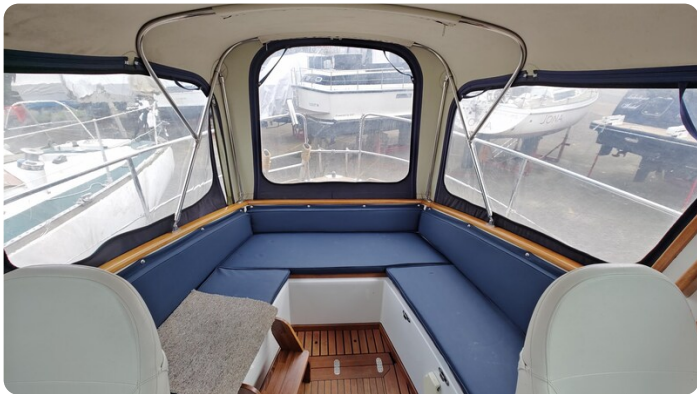
Spitzgatt Kutter LADY 10