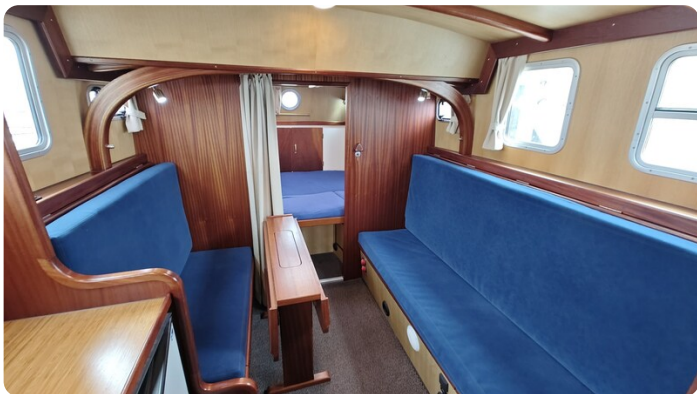
Spitzgatt Kutter LADY 13