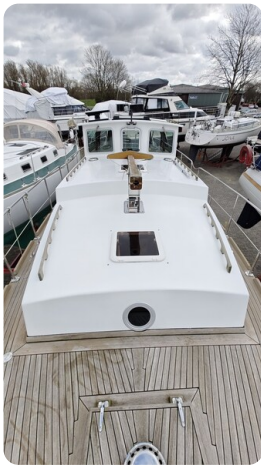
Spitzgatt Kutter LADY 6