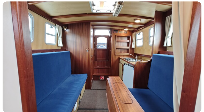
Spitzgatt Kutter LADY 14