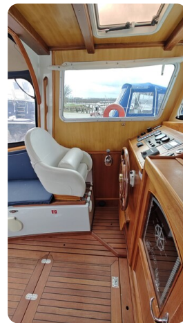
Spitzgatt Kutter LADY 9