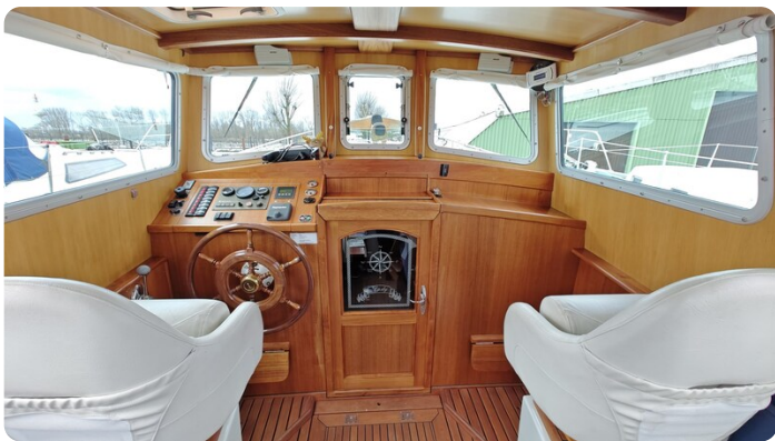
Spitzgatt Kutter LADY 7