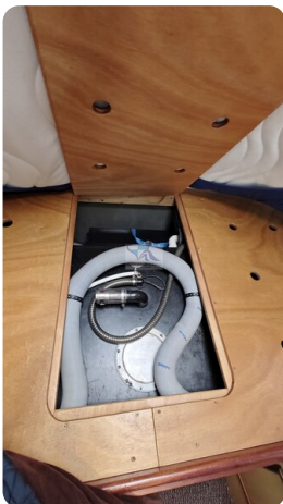
Spitzgatt Kutter LADY 94