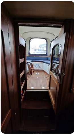
Spitzgatt Kutter LADY 63