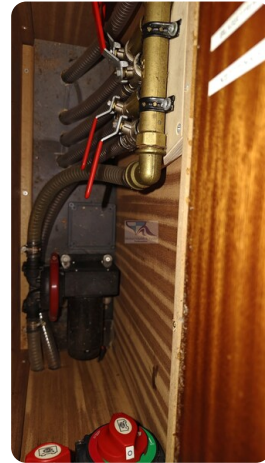
Spitzgatt Kutter LADY 59