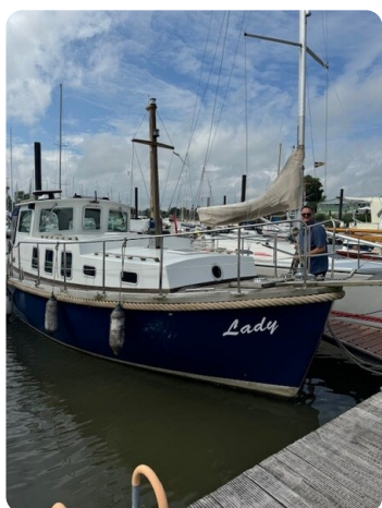
Spitzgatt Kutter Lady