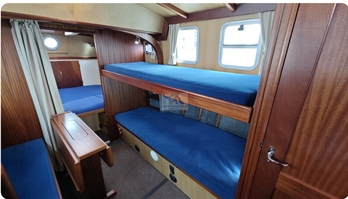
Spitzgatt Kutter LADY 67