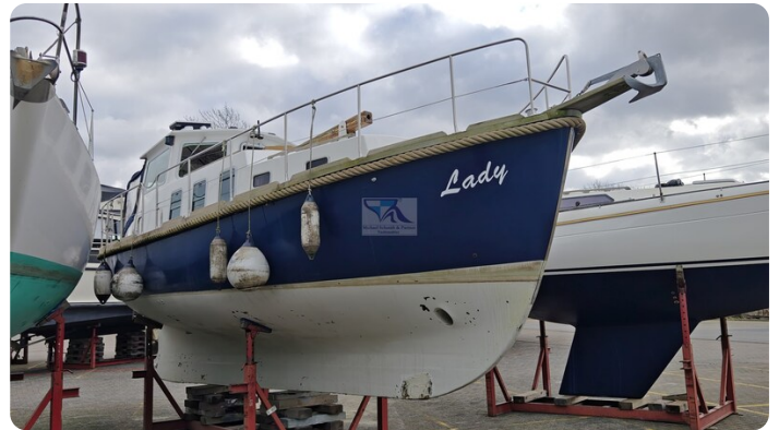
Spitzgatt Kutter LADY 7