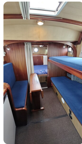
Spitzgatt Kutter LADY 70