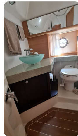
Cranchi 43 Méditerranée, bathroom.jpg