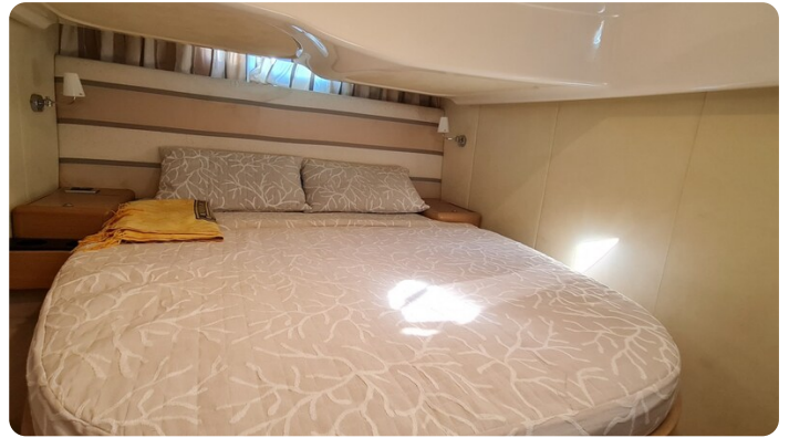
Cranchi 43 Méditerranée Vip