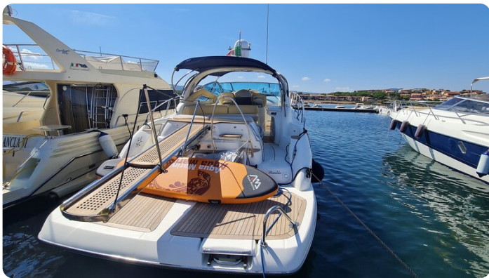
Cranchi 43 Mediterranée, aft view.jpg