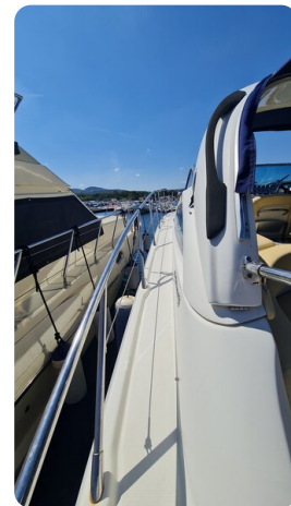
Cranchi 43 Mediterranée, sideways.jpg