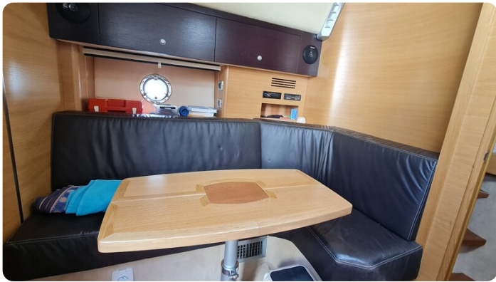
Cranchi 43 Méditerranée, dinette.jpg