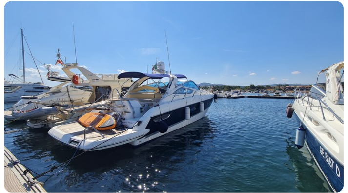
Cranchi 43 Mediterranée, aft profile.jpg