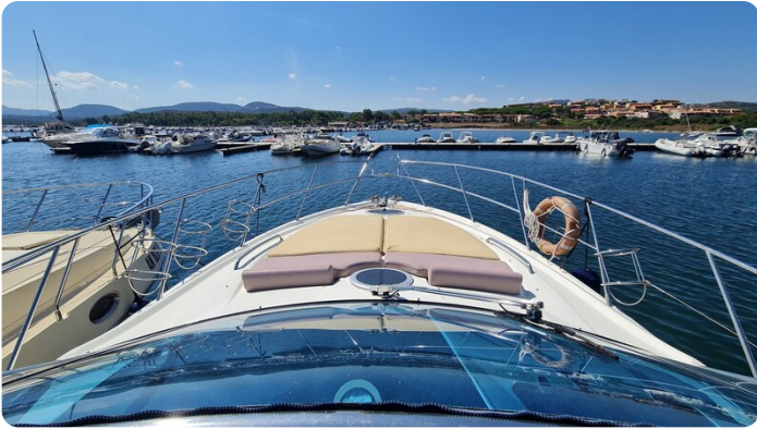
Cranchi 43 Mediterranée, fwd sunpad.jpg