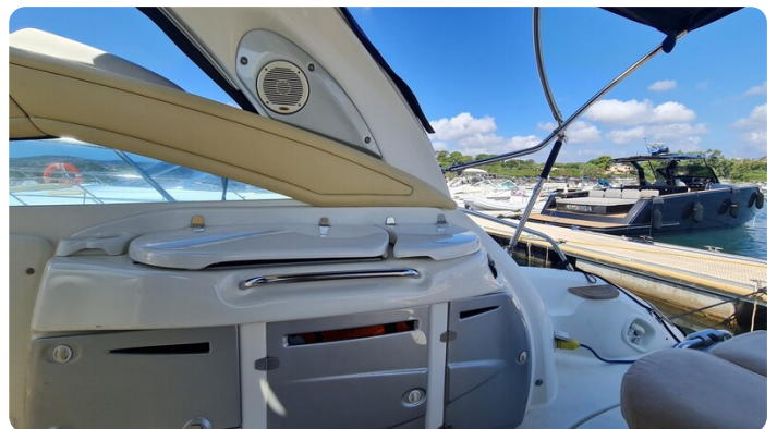
Cranchi 43 Mediterranée, cockpit galley.jpg