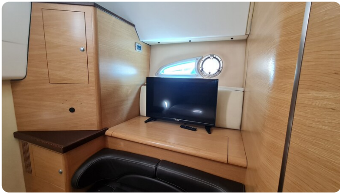
Cranchi 43 Méditerranée, details.jpg