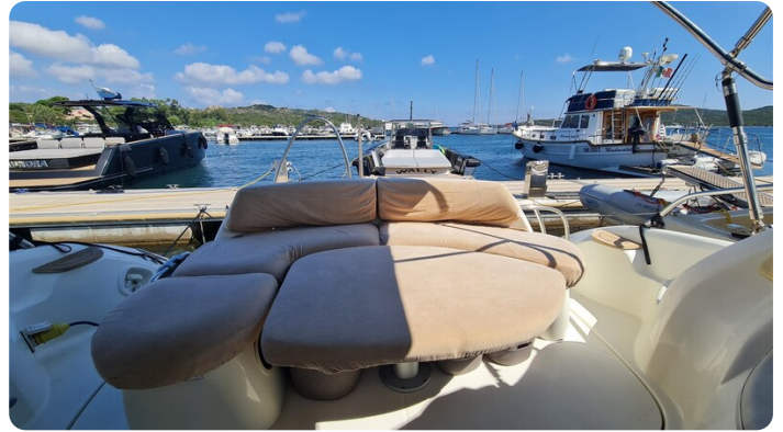
Cranchi 43 Mediterranée, sunpad.jpg