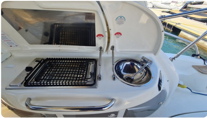
Cranchi 43 Méditerranée, cockpit grill.jpg