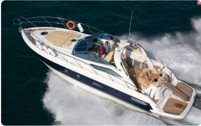
Cranchi Mediterranee 43