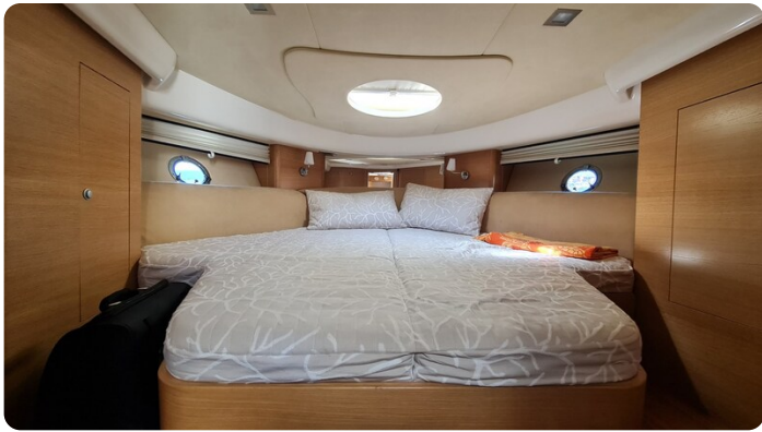
Cranchi 43 Méditerranée, owner's cabin.jpg