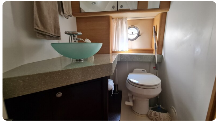
Cranchi 43 Méditerranée, bathroom view.jpg