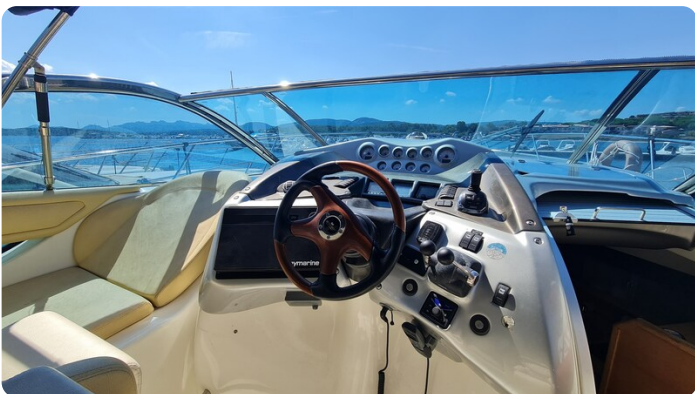
Cranchi 43 Mediterranée, helm station.jpg