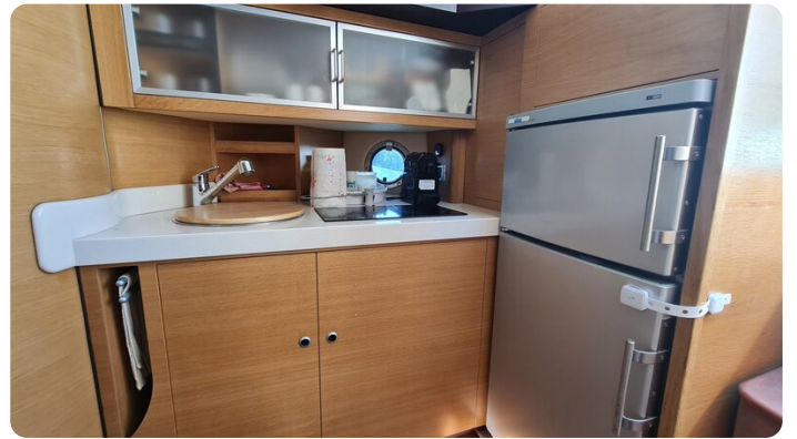
Cranchi 43 Méditerranée, galley.jpg