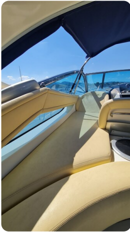
Cranchi 43 Mediterranée, lounge.jpg