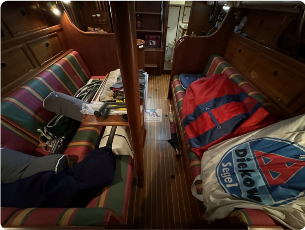
Contest 35S 28