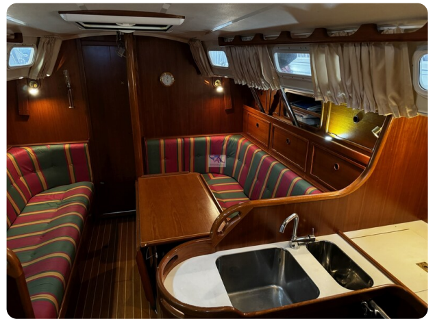
Contest 35S 17