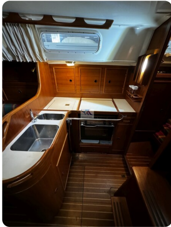
Contest 35S 5