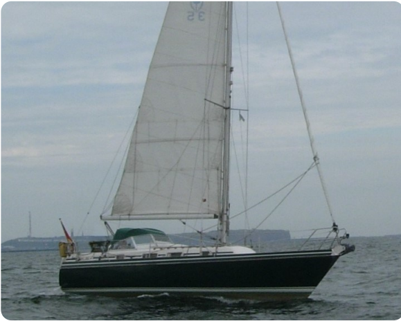
Contest 35S 44