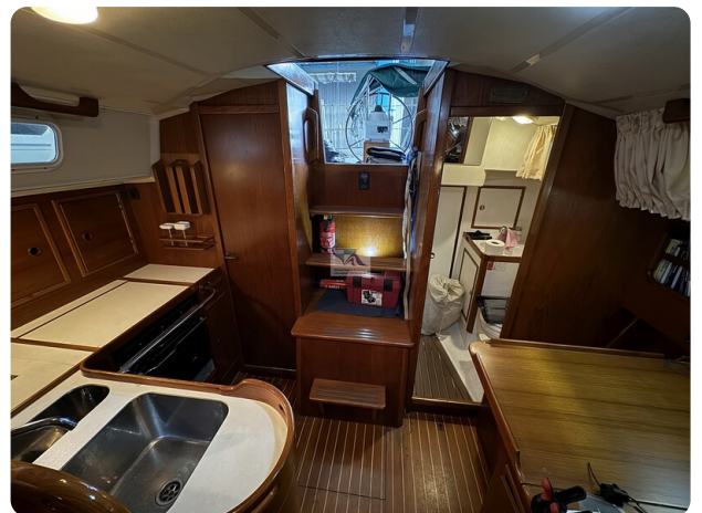
Contest 35S 22