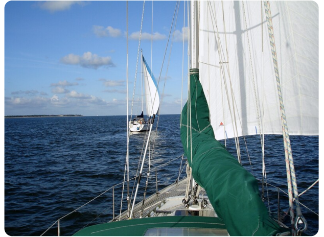
Contest 35S 41