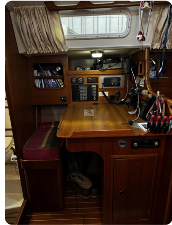
Contest 35S 8