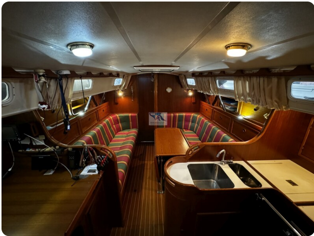
Contest 35S 13