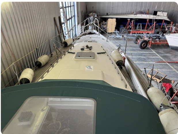
Contest 35S 31