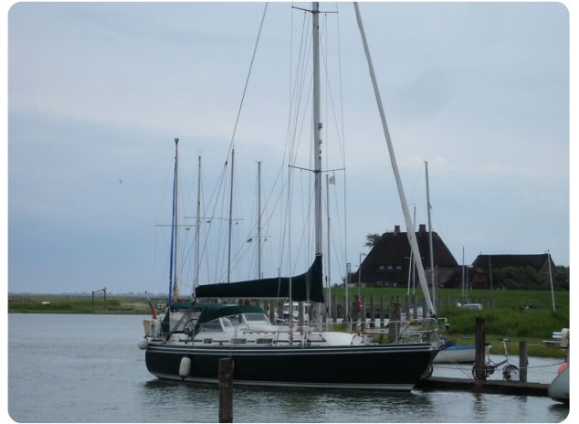
Contest 35S 43