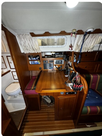
Contest 35S 9