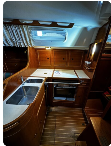
Contest 35S 4