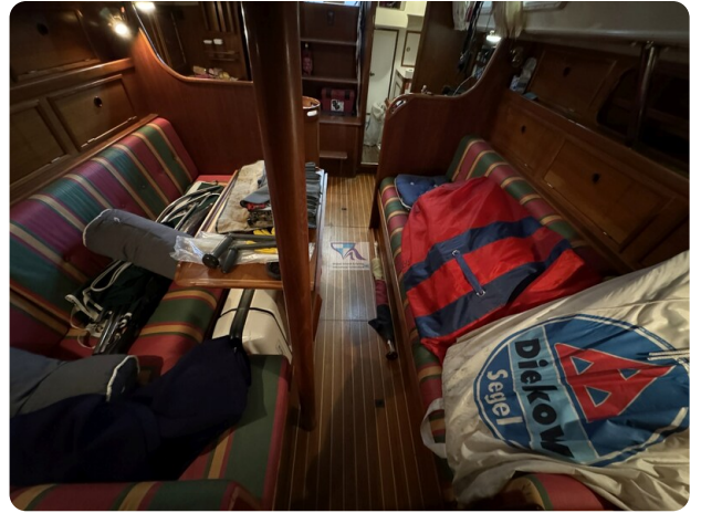
Contest 35S 27