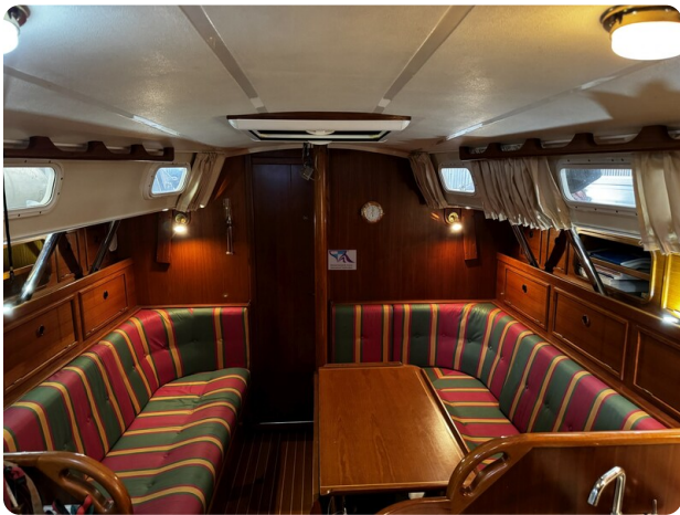
Contest 35S 16