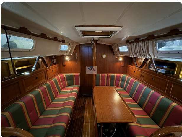
Contest 35S 20