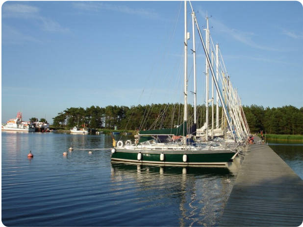
Contest 35S 42