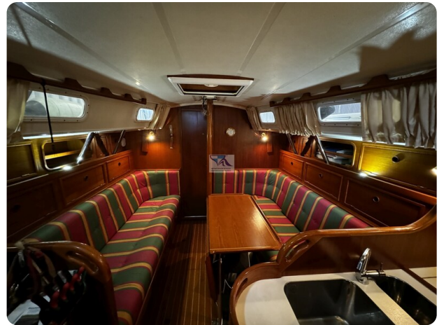
Contest 35S 14