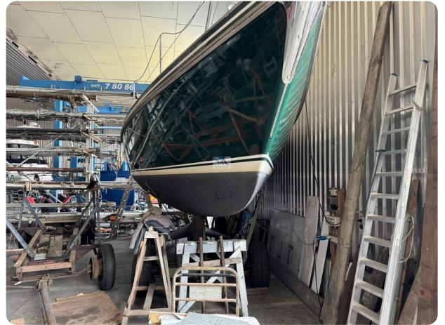
Contest 35S 38