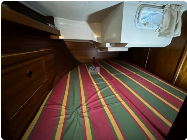
Contest 35S 1