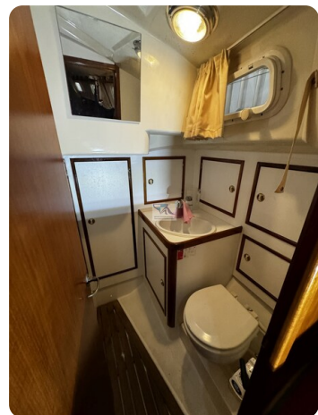
Contest 35S 11