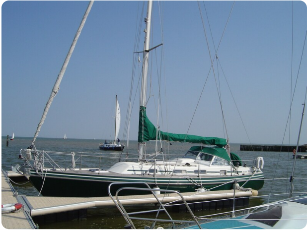
Contest 35S 40