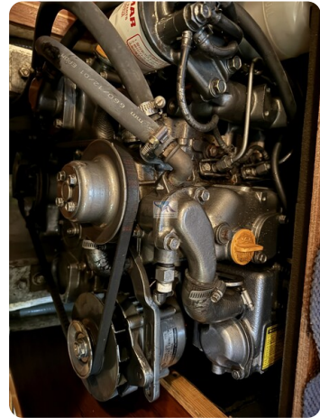
Contest 35S 29