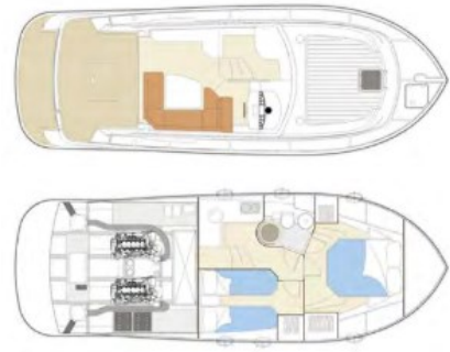
Goldstar 360 LAYOUT