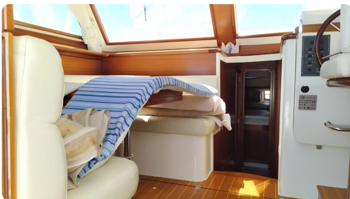
Goldstar 360 dinette esterna