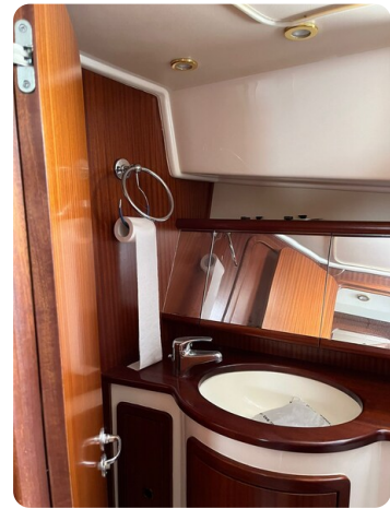
Goldstar 360 wc