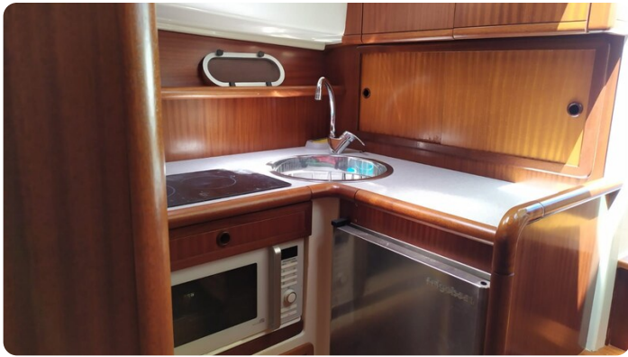
Goldstar 360 Cucina