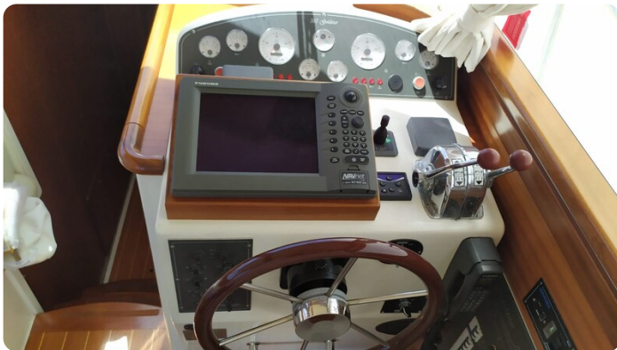
Goldstar 360 comandi