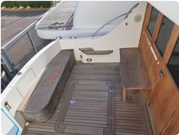
Goldstar 360 (13)