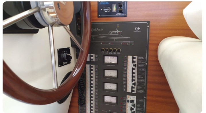
Goldstar 360 dettaglio