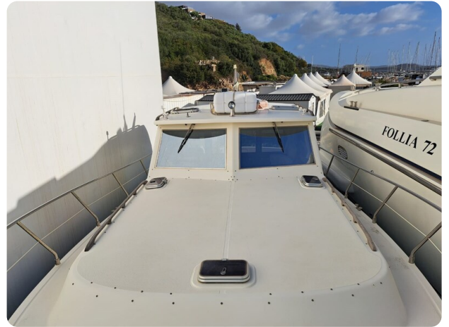
Goldstar 360 (10)