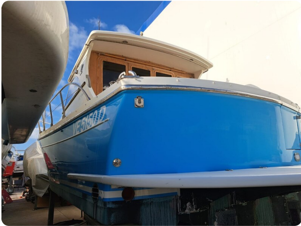
Goldstar 360 poppa