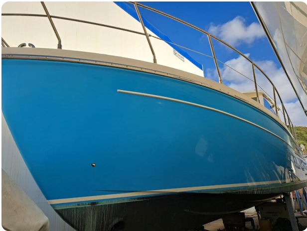
Goldstar 36 (1)