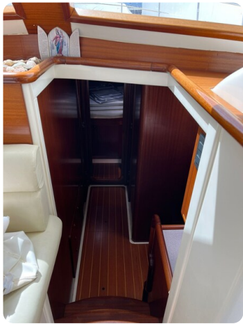
Goldstar 360 Ingresso