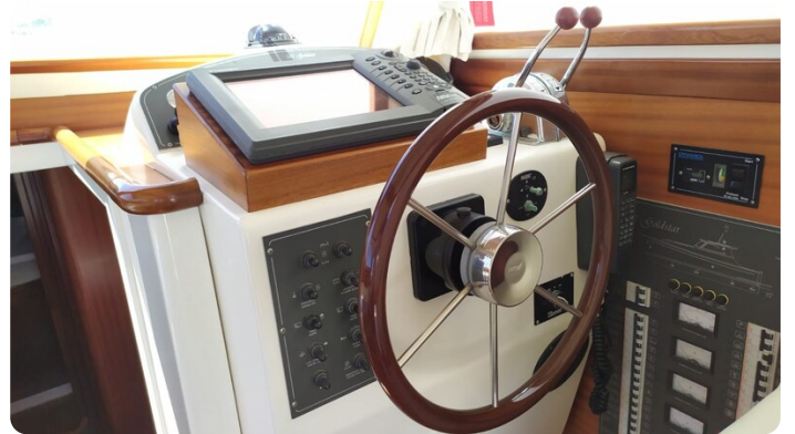
Goldstar 360 piloteria