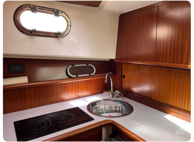
Goldstar 360 Cucina (23)