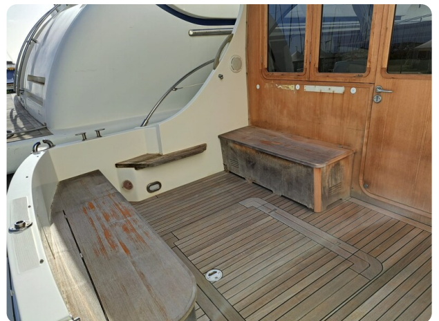
Goldstar 360 Pozzetto