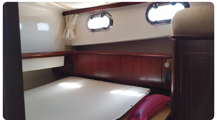
Goldstar 360 cabina armatoriale