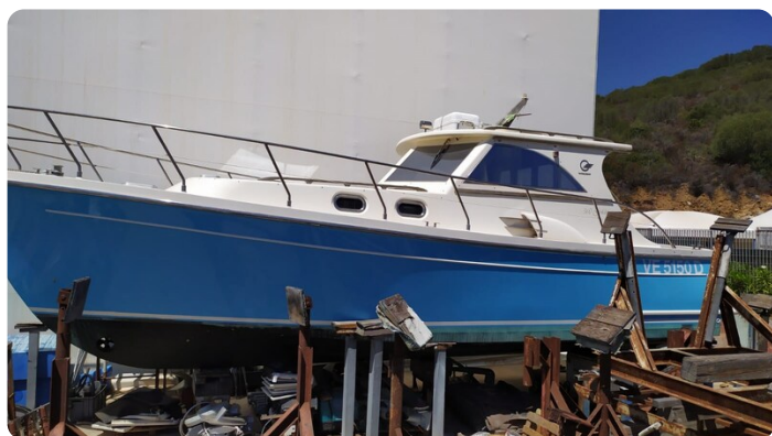
Goldstar 360 vista laterale