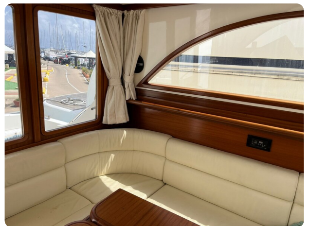
Goldstar 360 (22)