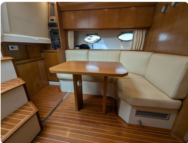
Sarnico Spider dinette