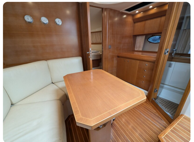
Sarnico Spider salon view