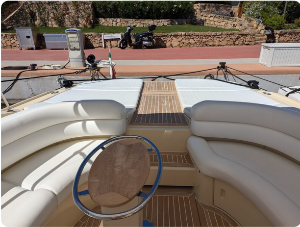
Sarnico Spider cockpit view