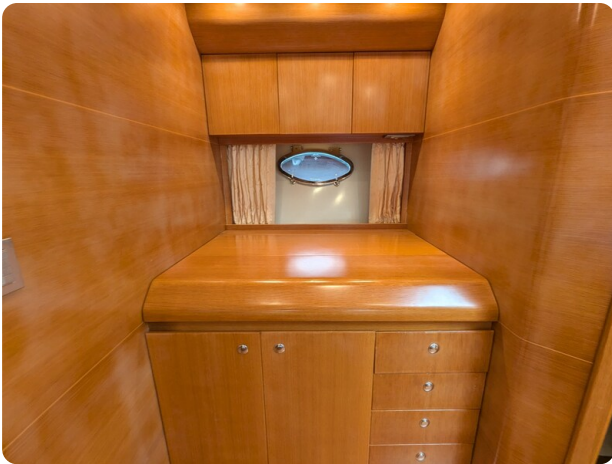
Sarnico Spider galley, closed