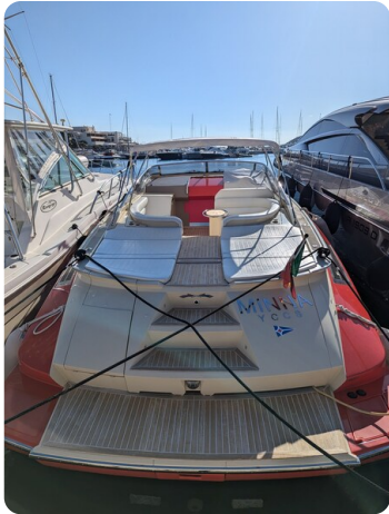
Sarnico Spider stern