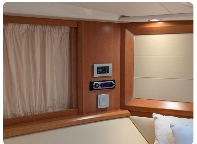
Sarnico Spider owner's cabin detail