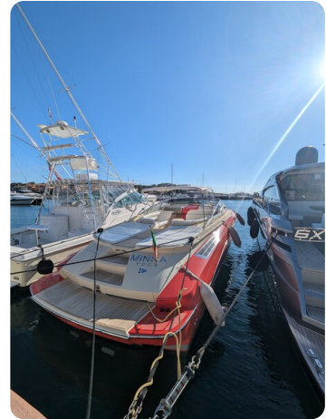
Sarnico Spider moored