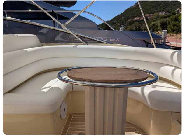
Sarnico Spider cockpit dinette