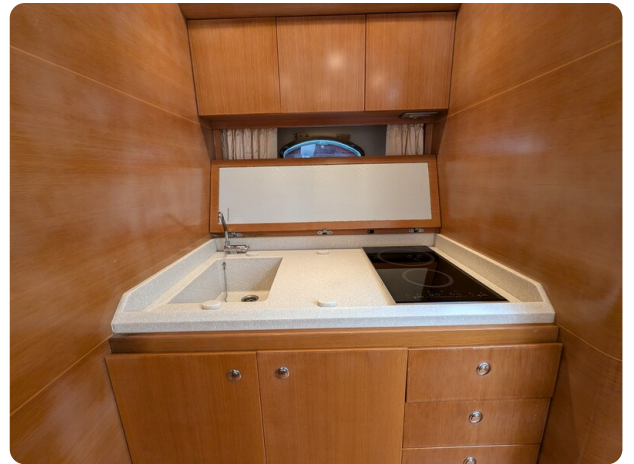
Sarnico Spider galley