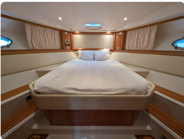
Sarnico Spider owner's cabin