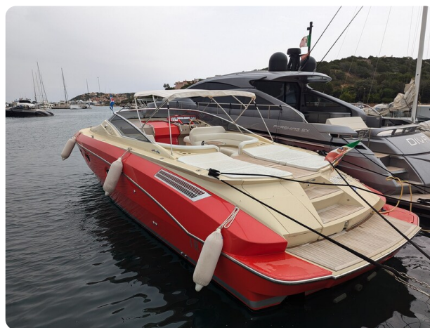
Sarnico Spider aft profile