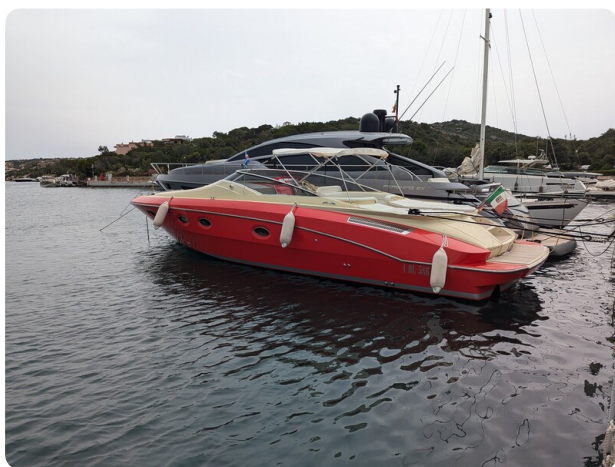
Sarnico Spider, profile