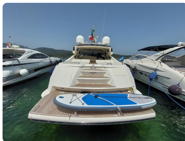
Sarnico 60 RiAl aft view