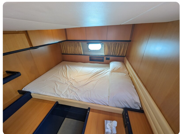
Cantieri di Sarnico 68 vip cabin