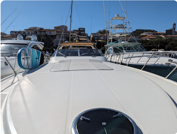
Cantieri di Sarnico 68 exterior