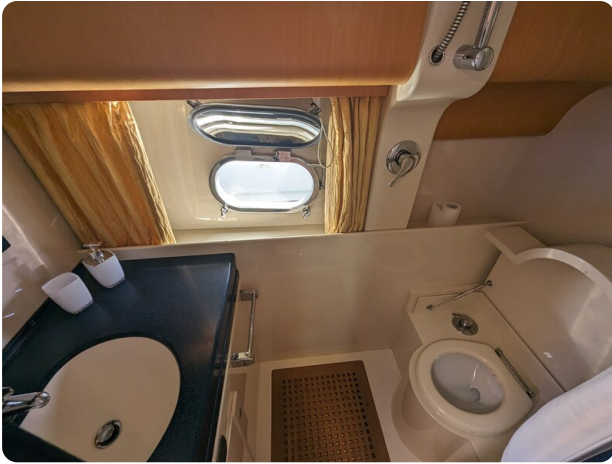
Cantieri di Sarnico 68 wc2