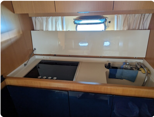
Cantieri di Sarnico 68 galley