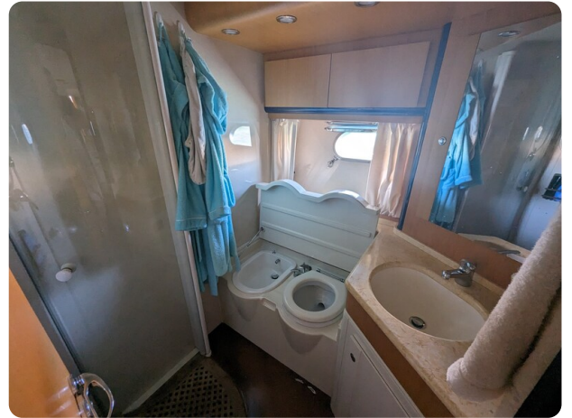
Cantieri di Sarnico 68 wc