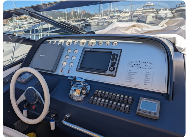
Cantieri di Sarnico 68