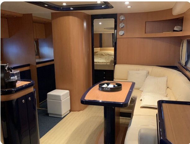
Cantieri di Sarnico 68 interior