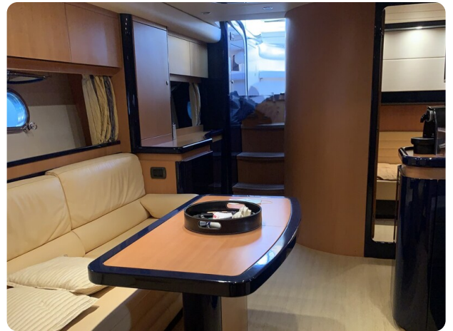
Cantieri di Sarnico 68 dinette