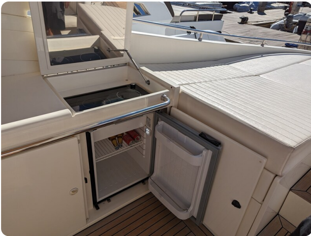
Cantieri di Sarnico 68