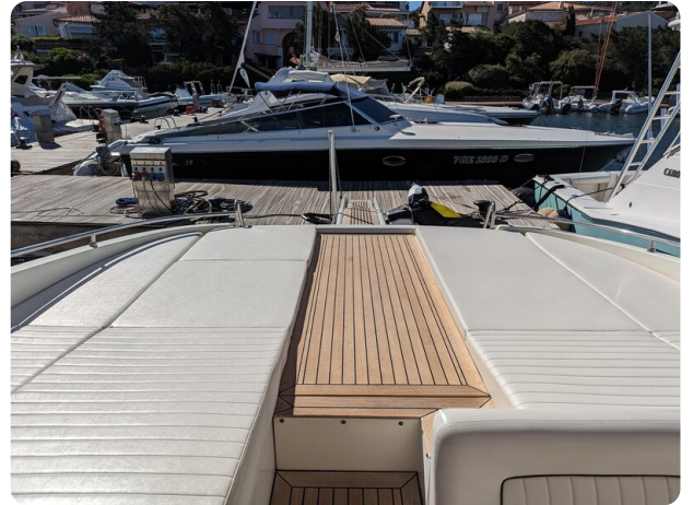
Cantieri di Sarnico 68 poppa