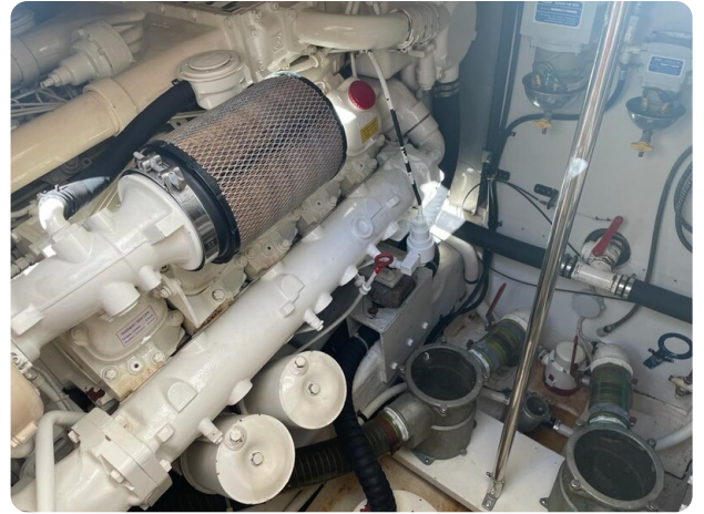
Cantieri di Sarnico 68 engine room