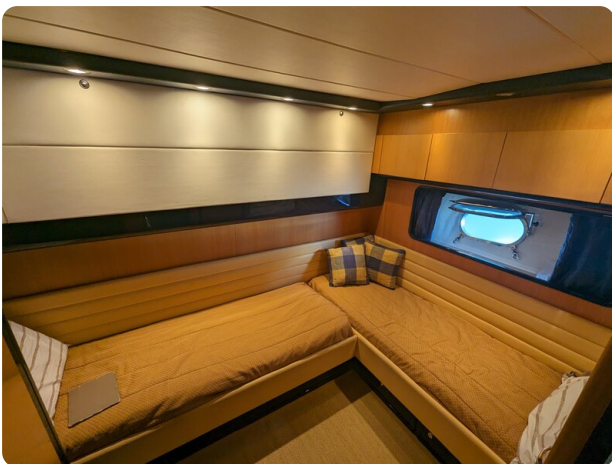
Cantieri di Sarnico 68 double cabin