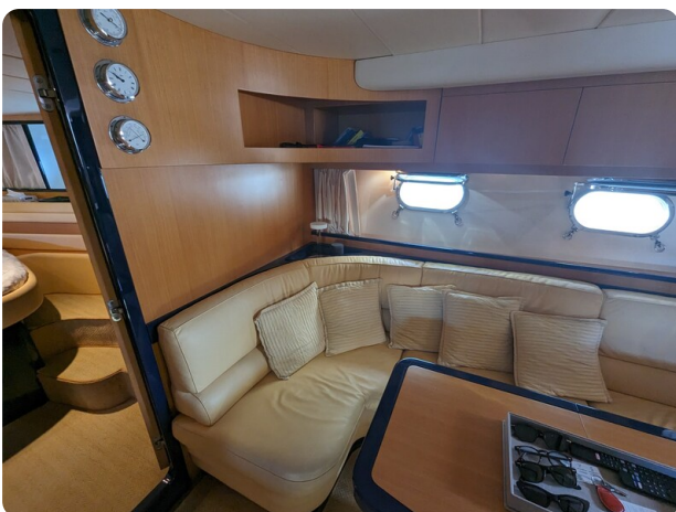
Cantieri di Sarnico 68 interior