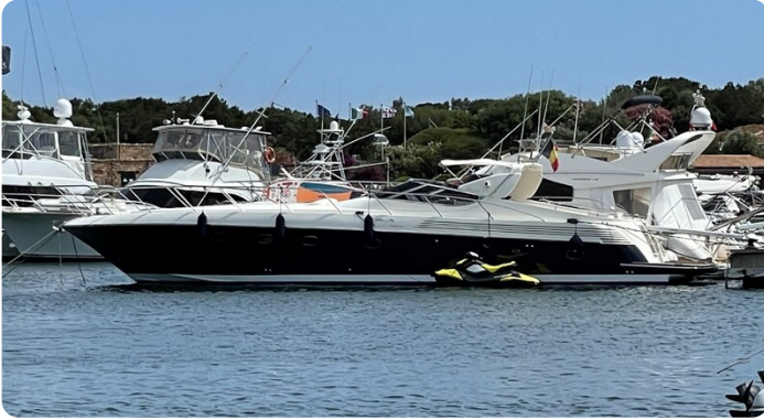
Sarnico 58 profile