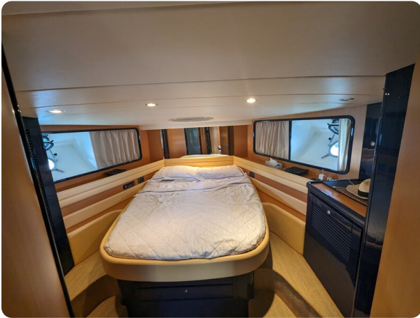
Cantieri di Sarnico 68 mastercabin