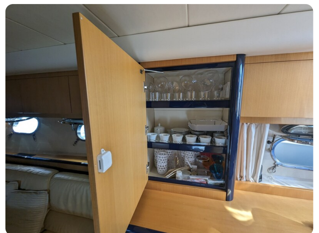
Cantieri di Sarnico 68 detail