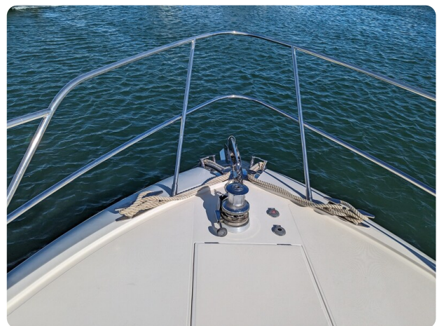
Cantieri di Sarnico 68 bow