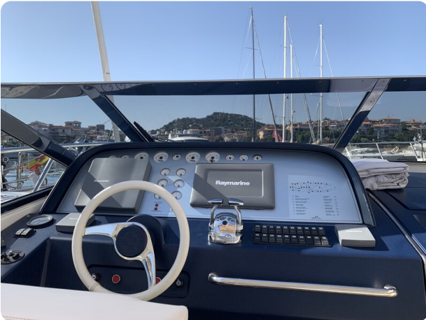
Cantieri di Sarnico 68 plancia