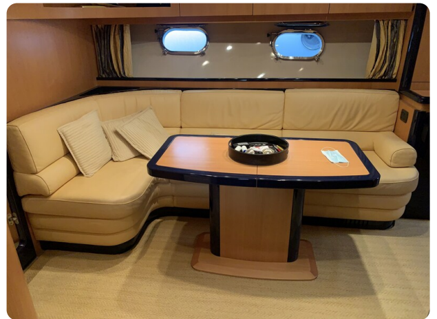
Cantieri di Sarnico 68 salon