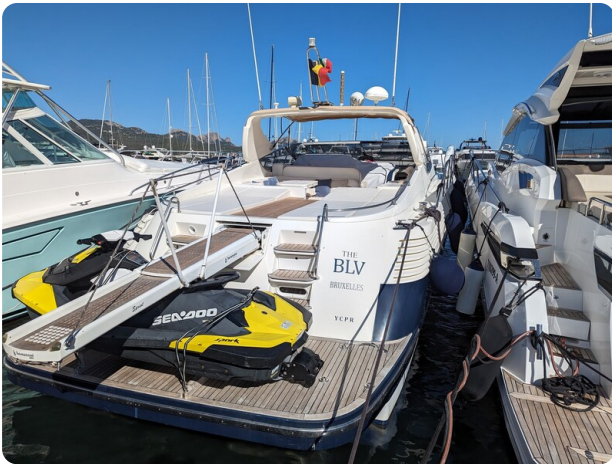
Cantieri di Sarnico 68 poppa