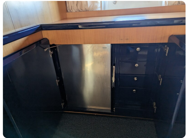
Cantieri di Sarnico 68 storage