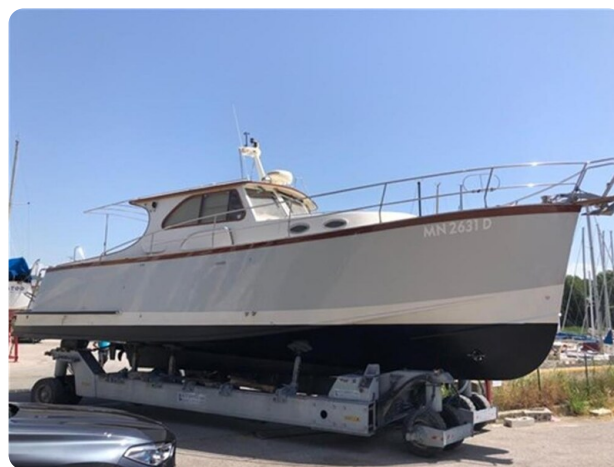
El Sentio side view