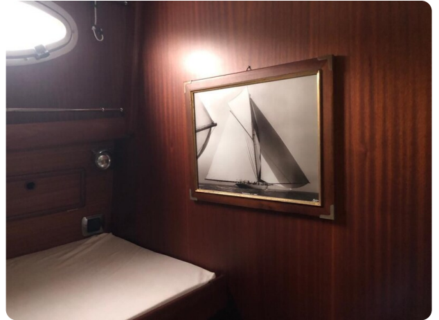
Guest cabin detail