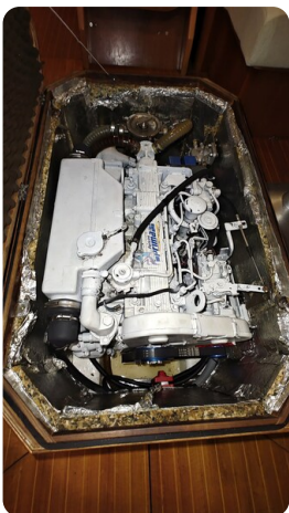
Grand Soleil 45 4