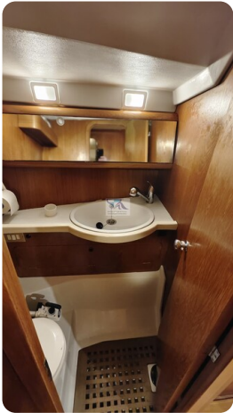
Grand Soleil 45 113