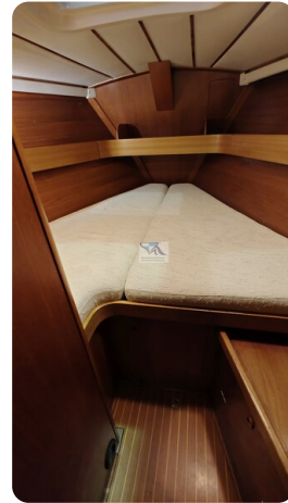
Grand Soleil 45 114