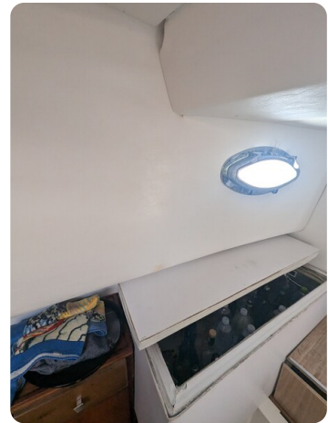
Canamer 33 details 2