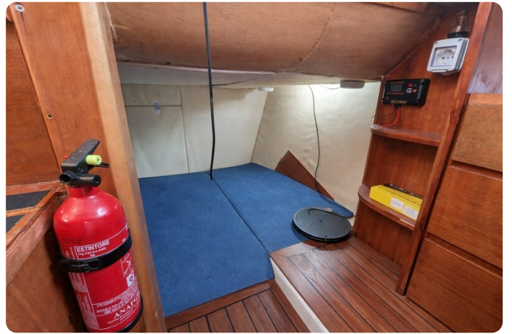
Canamer 33 aft cabin