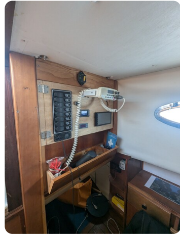
Canamer 33 detail