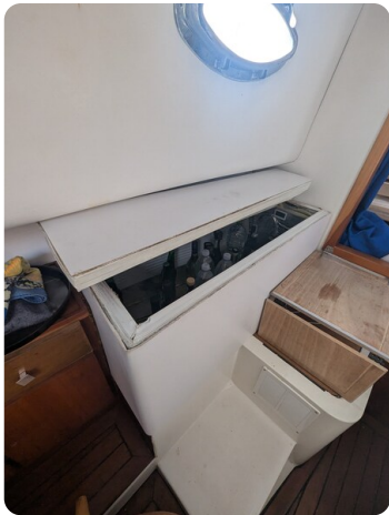
Canamer 33 details