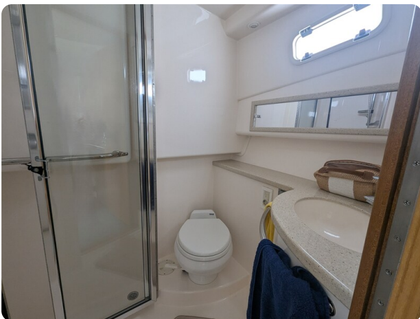
Cabo 38 Express bathroom