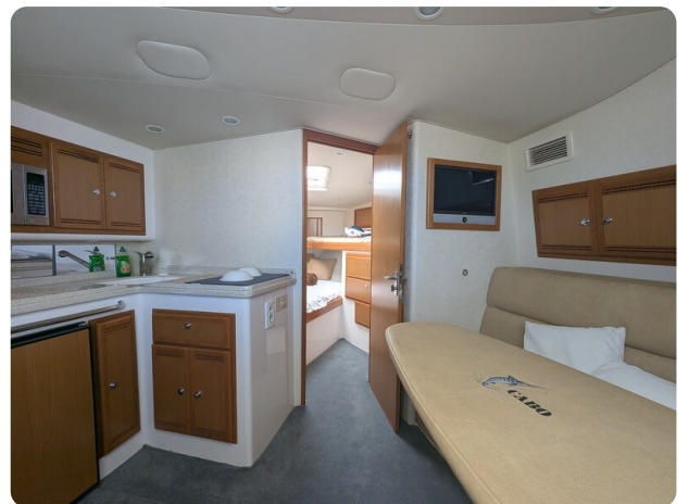
Cabo 38 Express interiors