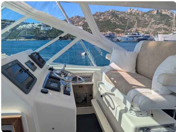
Cabo 38 Express helm station