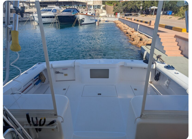
Cabo 38 Express cockpit view