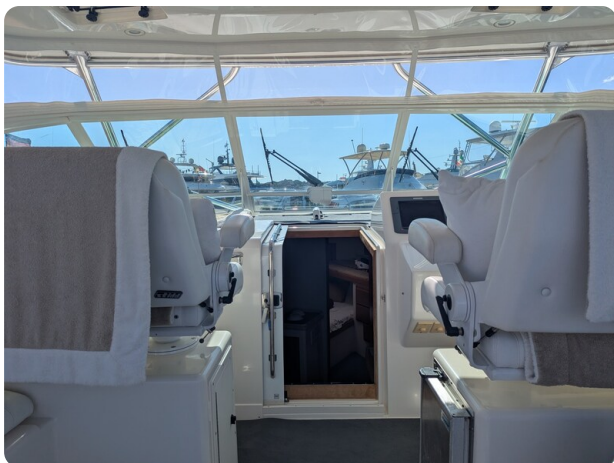
Cabo 38 Express upper cockpit