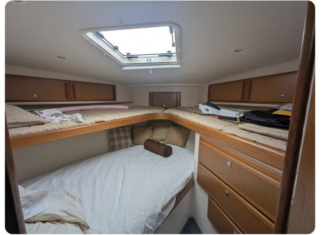
Cabo 38 Express cabin