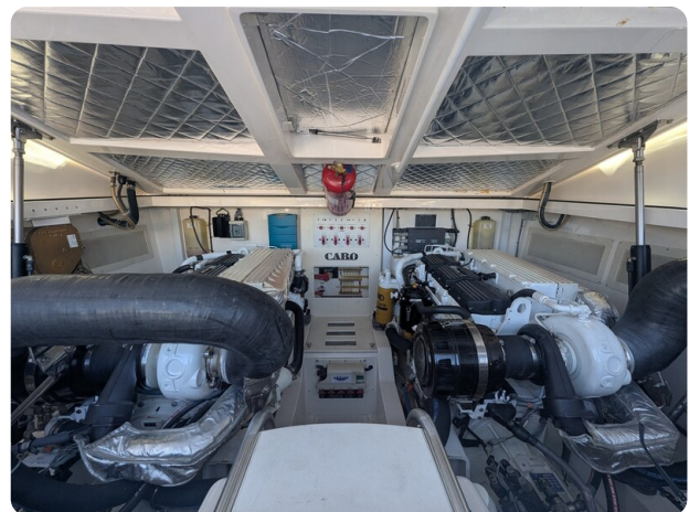
Cabo 38 Express engine room