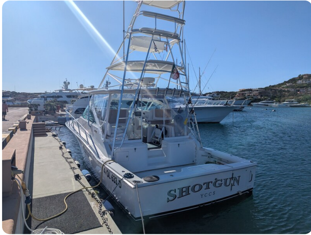
Cabo 38 Express stern view