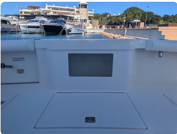
Cabo 38 Express live baitwell