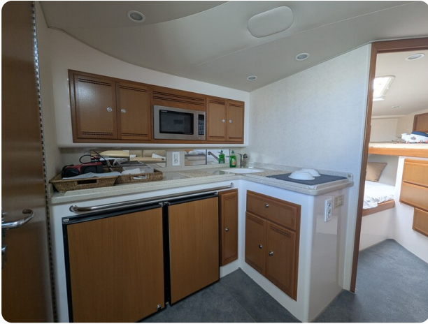
Cabo 38 Express galley