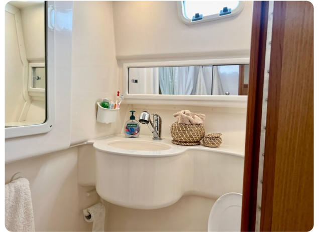
Cabo 32 Express bathroom