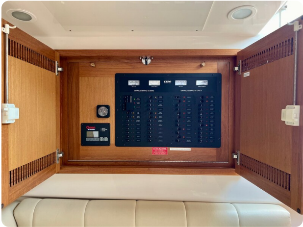
Cabo 32 Express electrical panel