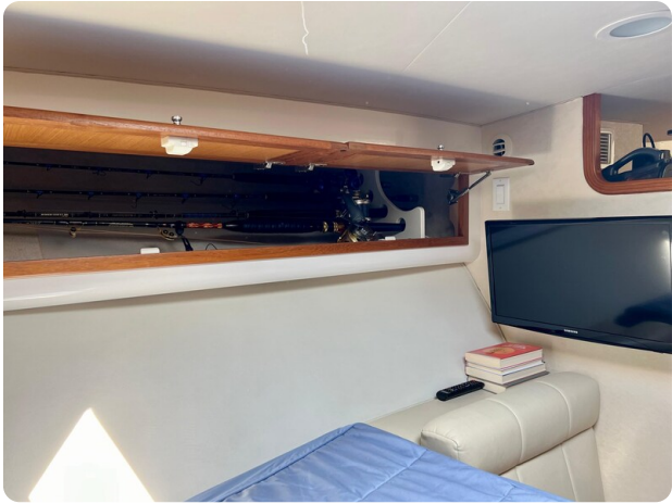
Cabo 32 Express dinette details