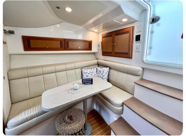
Cabo 32 Express dinette