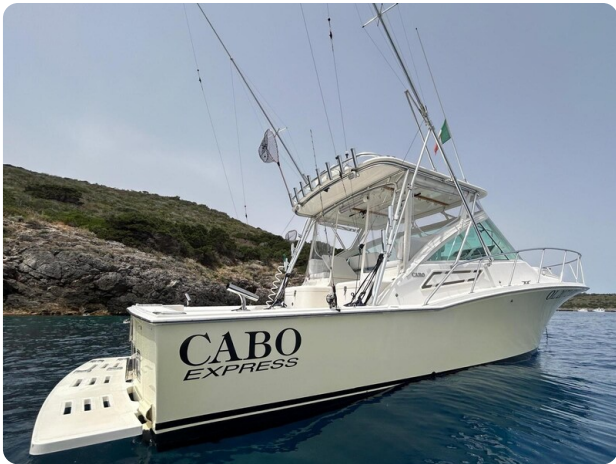
Cabo 32 Express, angle